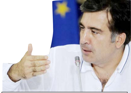
„ისევ სააკაშვილის დამკაშები არიან დარჩენილი სასულიერო თუ საერო ცხოვრებაში. კიდევ ვიმეორებ, თუ „ნაციონალური მოძრაობის“ წარმომადგენლებს სათანადო ადგილი არ მიუჩინეს, არ შეგაგონებენ, რა ღალატი აქვთ ჩადენილი, აქციებსა და პროფაკციებს სწორედ „ნაციონალებისგან“ უნდა მოვლოდეთ. ისინი თავის ნებაზე არიან მივებულნი და რასაც უნდათ, იმას აკეთებენ“

ისიც ხომ ვნახეთ, რამდენი ადამიანი გამოვიდა „კაზანტიპის“ გასაპროტესტებლად. მე გულისწყრომას გამოვთქვამ ანაკლიის და მის მიმდებარე ტერიტორიაზე მცხოვრები მოსახლეობის მიმართ, რადგანაც მათ, როგორც ამბობენ, ბანკებიდან ვალი აიღეს, რათა გაემდიდრებულყვნენ. რად უნდათ ასეთი გზით მოპოვებული ფული? ჩვენ ვხედავდით სამეგრელოში მრავალრიცხოვან მიტინგებს „ნაციონალების“ დასაცავად, მაგრამ იქაც სულთერება კოჭლობს. ისევ სააკაშვილის დამკაშები არიან დარჩენილი სასულიერო თუ საერო ცხოვრებაში. კიდევ ვიმეორებ, თუ „ნაციონალური მოძრაობის“ წარმომადგენლებს სათანადო ადგილი არ მიუჩინეს, არ შეგაგონებენ, რა ღალატი აქვთ ჩადენილი, აქციებსა და პროფაკციებს სწორედ „ნაციონალებისგან“ უნდა მოვლოდეთ. ისინი თავის ნებაზე არიან მივებულნი და რასაც უნდათ, იმას აკეთებენ.