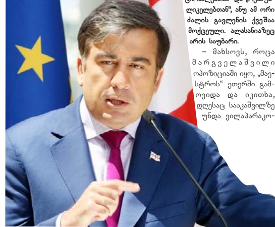
„ალბათ, სააკაშვილი ამიტომ დადგა საკონსტიტუციო აღრიცხვებზე, სხვა რა მიზანი უნდა ჰქონდეს? მის საქართველოში ჩამოსვლადაც შეუძლია, არჩვენებში მიიღოს მონაწილეობა, მაგრამ, თუ მანამდე მოუსაჯეს, მაშინ კი ამაზე ჩაემუშავება. ვნახოთ, ალბათ, პროკურატურა ასეც მოიქცევა, 2016 წლამდე მიზან რამდენიმე წელს აუცილებლად მიუსჯიან.“

უფლებების დემონსტრირება დაიწყო. არავის არ სჭირდება მარგველაშვილის უფლებები, თუ ის არ გამოიღინარეობს სახელმწიფო ინტერესებთან. ასეთი კონკლავობა ყველა დროის ხელისუფლებაში იყო... მაგალითად, ჩემ დროს ჩვენსა და