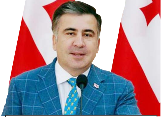
„საკაშვილზე სისხლის სამართლის საქმე რომ აღიძრა, ეს ფაქტიც გაისხნეთ, არც პრეზიდენტის ადმინისტრაციამ და არც სახელმწიფო დეპარტამენტმა არ გააკეთეს განცხადებები და ის ჩვეული აღმოუჩნდა კი არ გამოხატეს, რასაც ადრე ხშირად აფიქსირებდნენ სხვა მაღალი თანამდებობის პირების წინააღმდეგ იგივე ქმედებისას“

— კი არ ვვარაუდობ, ეჭვიც არ მეპარება. არჩევნების წაგების მერე სააკაშვილმა დაინახა, რომ ძალაუფლება ხელიდან ეცლებოდა, ძალაუფლების გარეშე მას ნარკობრუნები შენარჩუნება გაუჭირდებოდა და ცხადია, თალიბებთან თადარიგს იჭერდა, ურთიერთობებს ალაგებდა და გარანტიებს აძლევდა, რომ ეს მარშრუტი მისი პრეზიდენტობის შემდეგაც იმუშავებდა. სახელმწიფო, ასე არ მოხდა, „ნაციონალიზმის“ მიერ ამუშავებული ეს მარშრუტი გაიშვირა და ჩაგრა. აქვე გავისხებით ერთი უმნიშვნელოვანი დეტალიც, არჩევნებამდე ერთი თვით ადრე, საქართველოში ჩამოვიდა ამერიკის ცენტრალური სადაზვერუო სამსახურის დირექტორი და მისი ვიზიტის შესახებ არც არაფერი თქმულა. ჩემი აზრით, ვანო მერაბიშვილი, როგორც ამ ნარკობრუნების ერთ-ერთი მფარველი, სწორედ ამერიკელთა მოთხოვნით გაათავისუფლა სააკაშვილი თანამდებობიდან. და არა მარტო მერაბიშვილი, თავად სააკაშვილი ნაწილობრივ სწორედ ამ ამბავს გადააყოფს. მარტოა, მას ამერიკა მეტ რამეში მხარს უჭერდა, მაგრამ ბოლოს, თითქმის ყველაწინა მხარდაჭერა დაკარგა და ამერიკელები მხოლოდ განცხადებების დონეზე შემოიღარ-გლებოდნენ და ისიც, ცალკეული კონგრესმენები და სენატორები, აღარც სახელმწიფო დეპარტამენტი და აღარც პრეზიდენტის ადმინისტრაცია სააკაშვილისა და „ნაციონალიზმის“ მხარდაჭერას აღარ აფიქსირებდა. მათ ჩინებულად იცოდნენ, რომ მიხეილ სააკაშვილი იყო თანამედროვე გენერალი ნორიეგა, რომელსაც ათეულობით ტონა ნარკოტიკი გაჰქონდა ევროპაში. აი, სწორედ ეს არ აბატის და აღარც