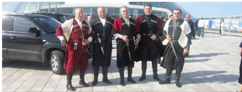
„რა საშუაარსო, რომ ჩვენს ერს ხელისუფლებასა და პოლიტიკოსებში არ გაუმართლა. ყველამ იცის, რომ თუ ხელისუფლების წინააღმდეგ წავა, კარიერას ვერ გაიკეთებს, ამიტომაც არ აკეთებენ საზოგადოებისთვის ანგარიშგასწავლვ განცხადებებს. იქ არ მინახავს ის ადამიანები, ვინც პარლამენტში ჩიზა-ახალუხით დადიან და კამერების წინ პოზიორებენ ხოლმე“

რაც მეტად შეუწყობს ხელს ხელისუფლებმა ამგვარ ვითომ ფესტივალებს, ანუ ეკლესიის წინააღმდეგ აშკარა წასვლას, უკან შეუბრუნდება, თანაც ძალიან ცუდად, ეკლესიის წინააღმდეგ წასვლა არავის შერჩენია. ანტიდისკრიმინაციული კანონის მიღების შემდეგ, ხელისუფლების მხრიდან ეკლესიის შეგონების სანინააღმდეგო ქმედებები საზოგადოებაში დავამო, როცა მოსახლეობის დიდი უმრავლესობა არჩევნებზე არ მივიდა. ეს ტენდენცია დასანყისა და