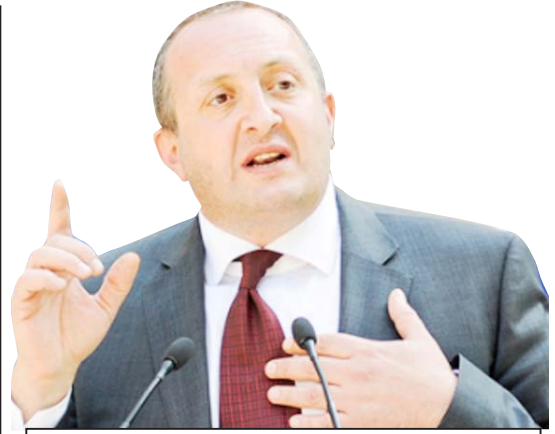
„მარგველაშვილი დღეს არღვევს თამაშის ყველა წესს, რაც კი მორალთან და წესიერებასთან არის დაკავშირებული. მან ძალიან კარგად იცის, რომ საქართველოს პრეზიდენტად არავის არ აუჩრჩევია, ის ფაქტობრივად, დანიშნული პრეზიდენტია. ახლა, ამის შემდეგ თუ საკონსტიტუციო კრიზისის შექმნას დაინწყებ, ეს უკვე უზუნოვანია.“

თარგამაძის ადგილას ვყოფ, აუცილებლად უჩივლებდი საკონსტიტუციო სასამართლოში. ახლა დავიწყეს: აი, დაბარებულა უნდათ, ეს უნდათ, ის უნდათ... მაგალითად, მე ისევ საქართველოს მოქალაქე ვარ და მოსკოვში ვმუშაობ ვინაობა, როგორც მინვესტი საცივალისტი. სხვათა საქართველოს მოქალაქეობას არ დათმობდ.