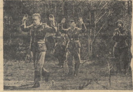
94-й Германский стрелковый полк был окружен частями Красной Армии. В течение 3-х дней фашистские воины голодали. Обер-лейтенант дал своему денщику задание выкопать для него в деревне колодезь...