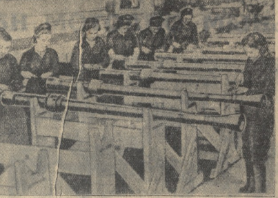
Англические десантники замешают мушкет, ушедших на фронт. На снимке: десантник за производством пушек на одном из английских военных заводов. (Передано по быдлу из Англии, ТАСС).