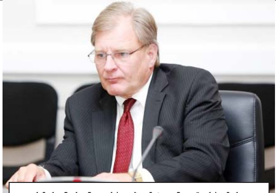
„რიჩარდ ნორლანდი არის დიპლომატი, „ენდიას“ არის ამერიკული არასამთავრობო ორგანიზაცია, შესაძლოა ჩვენზე უკეთ იცის ბატონმა ნორლანდმა, რა ხდება „ენდიას“ საქართველოს წარმომადგენლობაში და რა პრობლემები შექმნა ბატონმა ლუის ნავარომ, მაგრამ იგივე ნორლანდის ინტერესშია, ბოლომდე არ გააქარწყლოს და არ მოახდინოს „ენდიას“ დისკრედიტაცია“

— როგორ არ გამოიწვევს... დღევანდელი პოლიტიკოსები სარკის წინ დგებიან და საკუთარი თავის ექსპოზიციებით აღივსებიან ხოლმე. წარმოადგინეთ ახლა ამ პოლიტიკოსებს როცა უბნები, რომ საკმაოდ პოპულარულია საზოგადოებაში, ბუნებრივია, ეს აღძრავს მათში ამბიციებს, რომ გახდნენ დამოუკიდებელი პოლიტიკური მითამაშეები. ამას ისიც შეუწყობს ხელს, რომ თვითონაც იციან, ხელისუფლებაში დიდხანს ვეღარ გაჩერდებიან სხვადასხვა ობიექტური თუ სუბიექტური მიზეზების გამო, ამიტომაც შესაძლებელია, რომ ზოგიერთმა, ვიდრე მას თანამდებობიდან გაათავისუფლებენ, დაასწროს მოვლენებს და თვითონ მიიღოს გუნდიდან წასვლის გადაწყვეტილება. ჩვენ არ უნდა დაგვავიწყდეს, რომ მოდის 2016 წელი. ყველამ კარგად იცის, რომ ასეთი კონფიგურაცია და ასეთი პოპულარობა „ქართული ოცნებას“ აღარ ექნება, რადგან ბევრი სოციალური პრობლემა ქვეყანაში, რომელიც მოითხოვს სწრაფ რეაგირებას, მაგრამ ეს