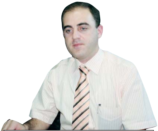
„მივირს, როცა არჩევნებს კაცი იგებს 72%-ით, ასე რატომ უფარდება რეიტინგი რამდენიმე თვეში? მოლოდინები მის მიმართ არსებობს. საქმის გაკეთებას ვერც მოასწრებდა, მაგრამ „სითი პარტიან“ პრინციპული პოზიციის დაფიქსირება და ის, რომ მოქალაქეების მიღება დაინიშნა, ამასაც აქცევენ ადამიანები ყურადღებას“

— კვლევა იმ დროს ჩატარდა, როცა „ნაციონალური მოძრაობის“ დამნაშავე ლიდერების დაჭერის გამო ღარიბაშვილმა განაწინებულ მასების გული მოიგო. ამით რის თქმა უნდა „ენდიას“, რატომ არ იმოქმედა ღარიბაშვილის რეიტინგზე დადებითად, რანაირად უნდა გადაესწრო მითვის ალასანია? — ეს მთლიანი თამაშის ნაწილია. მარგველაშვილის მაღალი რეიტინგი, ღარიბაშვილისა და ივანიშვილის დაბალი რეიტინგი ამით აიხსნება. პრობლემა დასმული კითხვების ფორმულირებაში უნდა ვეძებოთ. — ციფრებს რომ თავი დავანებოთ, ამით ქართველ საზოგადოებებში წილის არა მარტო „ენდიას“, აშშ-ც კარგავს. — ჩემი თაობა იყო ყველაზე პროდასავლური და პროამერიკული თაობა, მაგრამ დღე ყველა ანტიდასავლურად განწყობილი. მე ვაგაკეთე ერთი დასკვნა ჩემთვის, რომ რაც უფრო შორს არის შერთებული შტატები, მით უფრო მიმხიდულია კარგია, რაც უფრო ახლოს მოდის, საკუთარ რეიტინგს ანადგურებს. ასე ხდება ყველა იმ ქვეყანაში, სადაც შევიდა და დემოკრატიის სახელით ქვა ქვაზე არ დაგროვა. სახელმწიფო ადმინისტრაციის სახელით საუბრობს ჯერადი შაკი და ამას ნინათ ისეთი სისულელე თქვა, გაოგანდი. თუ რუსეთი შეიყვანს ჯარს უკრაინაში, ჩვენი მეექვსე საზღვაო ფლოტი მივა ბელორუსის სანაპიროსთან. ქალი ლაპარაკობს