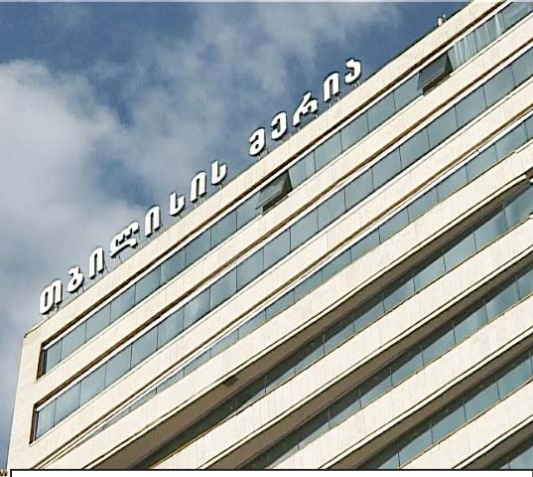
„არავის არაფერი შერჩება და ყველა ზღაპრს საკუთარი ნამოქმედარის საფასურს. 25 მილიონი კი არა, 25 ლარის უკანონო დახარჯვას არ ვაპატიებთ არავის. ეს ფული, 25 მილიონი, საგარეოდ და ლოგიკურად, „ნაციონარობის“ ლიდერთა საბანკო ანგარიშებზე დაილქა. ეს საქმე ზედმინეწით უნდა გამოიძიოს ფინანსურმა პოლიციამ და პროკურატურამ. უნდა გაირკვეს, სად წავიდა ამხელა თანხა. იმედი მაქვს, რომ ამ 25 მილიონის გამო, მერის არაერთი ყოფილი მაღალჩინოსნის პასუხისმგებლობის საკითხი დადგება“

- მეტრო 100 პროცენტით დოტაციურია და აქაც უნდა ჩავიხედოთ, რამდენად მიზნობრივად იხარჯებოდა მერის ბიუჯეტიდან მისთვის გამოყოფილი თანხები, სად მიდიდა, როგორ მიდიოდა... მოკლედ, ეს ყველაფერი გამოსაკვლევი და გასარკვევია. ძველი ვაგონები დარჩა და მერის მეტროში, ინტერვალი ძალიან დიდია მარშრუტებს შორის, ეჭვი მეპარება, რომ მეტროსთვის გამოყოფილი ფული არამიზნობრივად იხარჯებოდა, თორემ ასეთ სავალალო მდგომარეობაში არ უნდა იყოს არამხოლოდ სამგზავრო ვაგონები, მთლი-