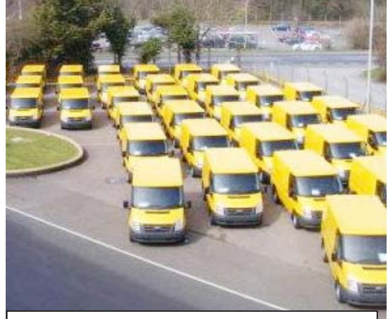
„აუცილებლად უნდა გადაიხედოს მძღოლებსა და ამ კომპანიებს შორის დადებული ეს კაბალური ხელშეკრულებები, მძღოლები მონებად ჰყავთ, ტრეფინგის მსხვერპლია ეს ხალხი. ამ ხალხს სჭირდება მხარდაჭერა და ისეთი კონტრაქტები უნდა გააფორმონ კომპანიებთან, რომ ღირსების შემოსავლი არ იყოს, მათი შრომის შესაფერისი ანაზღაურება უნდა ჰქონდეთ და სხვა ყველაფერი, რაც დასაქმებულ ადამიანს ეკუთვნის“

ტარიფი 50 თეთრიდან 80 თეთრამდე გააიჭირეს. მძღოლები ხომ კაბალურ პირობებში ჰყავთ და რა ვიცი, კიდევ მრავალი კითხვა არსებობს ამ კომპანიების შესახებ. მიმართ, ამ საკითხის ნამოწვევას ხომ არ აპირებთ? ამ კომპანიებს რა სახის ხელშეკრულებები აქვთ მერისთან გაფორმებული, ესეც ძალიან საინტერესოა. იმ 80 თეთრიდან, მგზავრობის საფასურად რომ იხდის ხალხი მიკროავტობუსებში, რამდენი მიდის მერის ბიუჯეტში, რას ხარადუბოდა ეს თანხები, ესეც გასარკვევია.