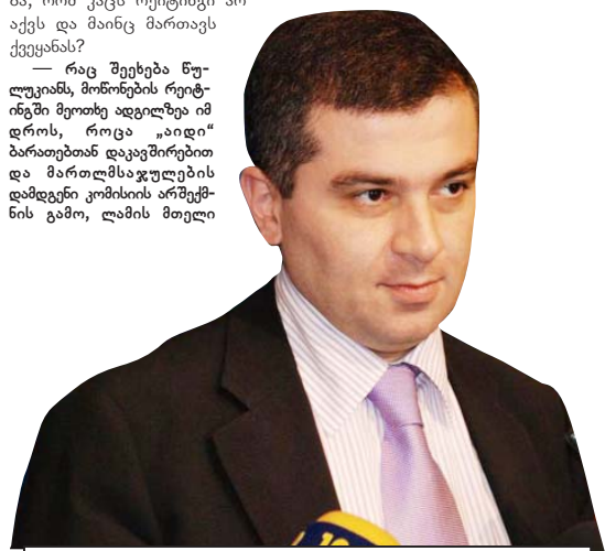
„რაც შეეხება ბაქრაძის 48%-ს, ბოლო დროს სულ არ ჩანს, ერთადერთი, როცა მისი გავარი განხიანდა, იყო ძალიან არასასიამოვნო ამბავი მისთვის, უცხოეთში დაგროვილი უზარმაზარი თანხის შესახებ. ეს პოზიტივი არ იქნება, მაგრამ თუ ვინმეს იმის თქმა უნდა, რომ მოსახლეობა აღფრთოვანებულია იმით, რომ ბაქრაძემ სახელმწიფო სამსახურში ყოფნისას მილიონობით ქონება დააგროვა, ეს კრიტიკას ვერ უძლებს“

მრველი გადაიკვიდა. როგორ მოხდა, რომ ნამყვანი ადგილი დაიკავა იმ დროს, როცა სერგეენკო არც კი არის ნახსენები?