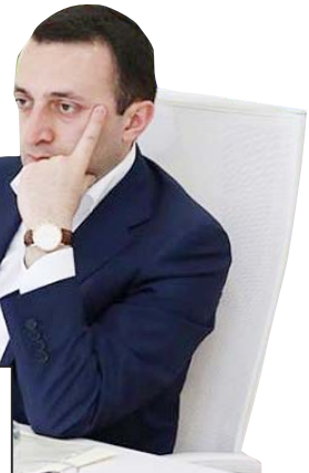
„ახლა ლარიბაშვილი ძალიან ფრთხილად უნდა იყოს, რათა სააკაშვილმა რაიმე შარში არ გახვიოს. რა თქმა უნდა, ის არ შეხედება, მაგრამ მაინც სიფრთხილად საჭირო“

ირაკლი აღასანიას რეიტინგს ისე წნებს მალა, ირაკლი ლარიბაშვილს ასწრებს. ამას მოსდევს ამერიკის ელჩის, რიჩარდ ნორანდის განცხადება, თურმე მისი აზრით, საქართველოში ყოველ წუთს არის მოსალოდნელი კრიზისი. მიუხედავად იმისა, რომ „ნაციონალური მოძრაობა“ ქართველი ხალხის დიდ ნაწილს სძულს, გარე