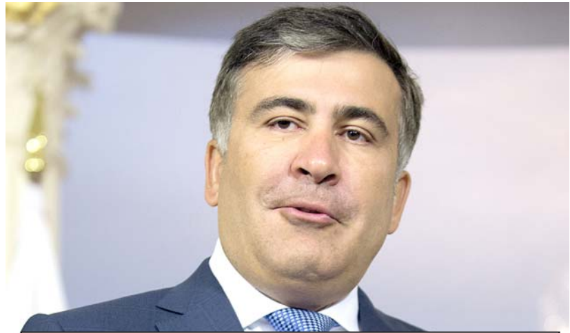
„მიხილ სააკაშვილის საბრძანებო მუშაობაზე ვეროპაში არაერთ არაფერს ამბობს, მაგრამ საკმაოდ ხშირად სვამენ კითხვებს საქართველოს ხელისუფლების მიმართ, როდესაც მიხილ სააკაშვილის ნინადადებებზე ალიძრა საქმე. ჩვენი ქვეყნის ხელისუფლებისგან იგნორირებულია ევროპული სივრცე“