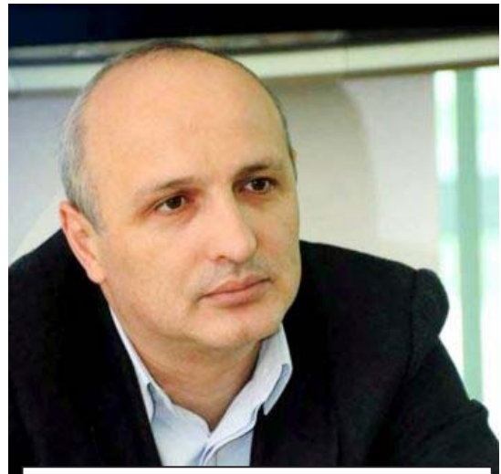
„არ მინდოდა ამის გახმაურება, მაგრამ ჩემი საუბარი უფრო გასაგები რომ გახდეს, ერთ-ერთი მნიშვნელოვანი თემა ვანი მერაბიშვილის საკითხი იქნება. დანარჩენი თავად ხელისუფლებამ უნდა გაარკვიოს. მზადდება რამდენიმე პაკეტი, რაც იქნება ძალიან მძიმე. „ნაციონალბაში“ იმუშავა ევროპარლამენტში, ჩაიტანეს იქ ინფორმაცია. სამწუხაროდ, ამ შრივ არ იმუშავა კოალიციამ“

„სრულდება სააკაშვილის დაჯივრება მის მიერვე შეწყობილი მკვლელების ხელით. ნახე, რა ოსტატურად გარის ერთ მკვლევარში ეკა ბესელიას შვილი, „ნაციონალბაში“ ამუშავებული აქვთ სიცრუის მანქანა — მე დაგაბრალბე და შენ მიდი და იწინდე ნამუსი. ეს არის სააკაშვილის იდეოლოგიის ერთ-ერთი მთავარი პოსტულატი — დააბრალბე, ტლაბში ამოსვარე, დანარჩენი უკვე აღარ არის საინტერესო“