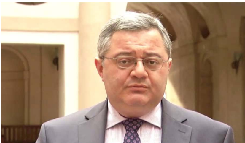
„დათო უსუფაშვილის ვიზიტები ბრიუსელში 22 შეხვედრიდან, 18 ჩემი გაკეთებულია 2012 წლის 1-ელ ოქტომბრამდე, მაშინ, როცა მათმა ლობისტებმა 22 შეხვედრიდან მხოლოდ 4 გააკეთეს“

დამთავრდება ნოემბერში. როცა ძველი მთავრობა მიდის და ახალი მოდის, სწორედ ამ დროს უნდა იყოს გაცხადებული მუშაობა. სამწუხაროდ, ჩვენი ხელისუფლების მხრიდან ამ მუშაობის პროცესს ვერ ვხედავ. სამაგიეროდ, ძალიან კარგად მუშაობს შიშა სააკაშვილი. მე თვითონ სკეპტიკურად ვარ განწყობილი ამ ყველაფრისადმი, რადგან ჩვენი ხელიდან ვუშვებთ შანსს, დაგვეტოვებინა ევროპისთვის ჩვენი სიძარბო. მიხილ სააკაშვილის საბრძანებო მუშაობაზე ვეროპაში არაერთ არაფერს ამბობს, მაგრამ საკმაოდ ხშირად სვამენ კითხვებს საქართველოს ხელისუფლების მიმართ, როდესაც მიხილ სააკაშვილის ნინადადებებზე ალიძრა საქმე. ჩვენი ქვეყნის ხელისუფლებისგან იგნორირებულია ევროპული სივრცე. მიშის შესაძლო დაკავებას ევროპელები ძალიან მხარედ აღიქვამენ. როგორც კი მიხილ სააკაშვილზე პროკურატურამ შიდა ძებნა გამოაცხადა, ევროპელები აღმოფთოდნენ და იცით, რატომ? დღემდე ვერ შეძლო ქართულმა დიპლომატიამ, ევროპასა და ევროპელებს დაუმტკიცოს, რატომ გააკეთა ეს საქართველოს ხელისუფლებამ. ეს ყველაფერი მიუთითებს ჩვენი მთავრობის აბსოლუტურ უსუსურობაზე საგარეო კუთხით. საქართველოს ხელისუფლებას ძალიან გაუჭირდება სააკაშვილის დაბრუნება და მერე საქართველო-