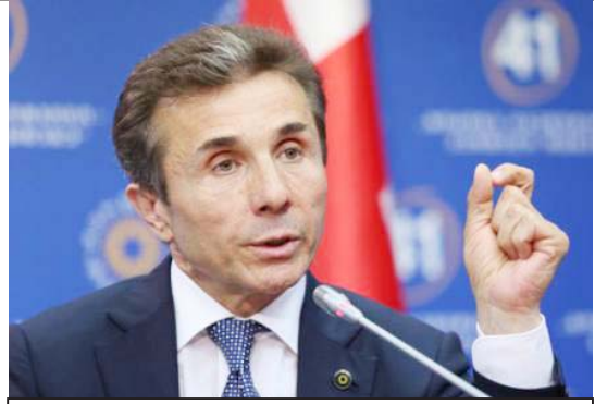
„ხაზგასათქვამია, რომ მათ დრო არ ჰქონდათ, რომ დაიჭირებინათ ბიძინა ივანიშვილი, მაგრამ ეს უსაფრთხოების სამსახური იყო, რომელიც სხვის პოლიტიკურ დაკვეთაზე მუშაობს და ეს სხვა, რასაკვირველია, არის „ნაციონალური მოძრაობა“. სამწუხაროდ, ამ მე-5 კოლონას ვერაფერი მოუხერხდა. ამიტომ სულ არ მივირს, რომ ივანიშვილს უსმენენ“

— მე არ ვთვლი, რომ ეს კარგი იდეაა. ტელეენაშენობის საკმარის რთული პროფესიაა, რომელსაც გამოციდილება სჭირდება. ფუნდამენტური ცოდნის გარდა, რაც ქართულ ტელევიზორებში უჭირს ხილია, სერიოზული გამოცდილება უნდა გქონდეს. ამ ასაკში ამ საქმის კეთებას დაწყება ბევრ უსწრებლობასთან იქნება დაკავშირებული და შეძლე-