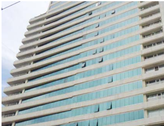
„თბილისის მერია „სითი პარკთან“ მოავაგრებს ამ საკითხს და ახალი სანომრე ნიშნების გამო დაჯარიმებულებს უკან დაუბრუნებს კომპანიას ამ თანხას. „სითი პარკის“ ამ გაუთვლელი ნაბიჯის, თუ შეგნებულ პროვოკაციის გამო, ხალხმა პასუხი არ უნდა აგოს. ამ მიმართულებით მერია რაღაც კონკრეტულ ნაბიჯებს დგამს“