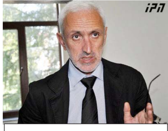
„სხვათა შორის, როდესაც დუმბაძის ხასიათზე ლაბარაკოდნენ, ერთ-ერთმა „რესპუბლიკელმა“ მითხრა, რომ, თუ მურმანს მისცემ ცოტაოდნ დალაგებულს, ინფორმებს ყველაფერს. ეს არის სერიოზული და ძალიან რთული არგუმენტი. მოკლეც, ამ კაცს ასეთი თვისება აქვს. პოლიტიკაში ბალანსის ხელშეწყობას თუ არ ფლობ, მაშინ რთულია იყო პოლიტიკაში. როგორც ჩანს, მურმანს დუმბაძე ბალანსის თვისებას მოკლებულია“

ამაზე საუბარი არ არის, მაგრამ ბევრი რამ რომ არ მოსწონს გუნდში, ეს მის ინტერვიოში იგრძნობა... მარგველაშვილთან მიმართებაში გზავნილი გასაცემია, პრინციპში ივანიშვილისთვის ეს ადამიანი, როგორც პიროვნება, აღარ არსებობს. ამას მე კარგა ხნის წინ მივხვდი, როდესაც პრეზიდენტის ინაუგურაცია ხდებოდა და როდესაც მარგველაშვილმა ივანიშვილის თხოვნა არ გაითვალისწინა, ეს არის ოჯახური საკითხი და ამას ვერ ვიტყვი.