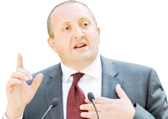
„ტყუალად ვფერებიან მარგველაშვილს ვილაცხვებ, ეს კაცი ვერ იტანს ქართველებს, ნახეთ, რას წერს ის ქართველ ერზე, როგორ შეიძლება ბოდა ვინმეს ხათირთ მისი არჩევა? გაიანჯისო საქართველო თავის წერილობა, მაგრამ არ დამიყვებენ. მარგველაშვილი იგივე ბოკეპია. არავითარი პრეზიდენტიც ვე არაა, არავის აურჩევია. ახლა მიდის პოლიტიკის თამაში“

მასობრივი მასურებული მისჩერებობა, მხოლოდ იმიტომ, რომ ტელევიზიები ამის გავრცელებაში ფულს იღებენ. ეს არის მეორე გზა. თუ არ აღუდევით მათ, თურქები რას კარგან? არის მოთხოვნა და გვაძლევენ ამ სერიალებს. სწორედ რელიგიითა და კულტურით ხდება ტერორიზმის დაკარგვა. მეფე დიმიტრის ფუსქენდი, ამზობდა, ჩვენი გაბესენით ქრისტიანული სკოლები. ეს საჭირო და აუცილებელია. მასოვს, როცა გამსახურდის დრო იყო, აჭარაში ვიყავი ჩასული მუხრანმა ძაჭარაძეა თუ არადა უფროსი ბავშვი მოვახატეთ. ახლა იქ საშინილება ხდება. ადრე იყვნენ მუსლიმანი მშობლები და შვილები — ქრისტიანები, ახლა ყველაფერი შეიცვალა, მშობლები დარწმუნდნენ ქრისტიანებად და შვილების უმრავლესობა