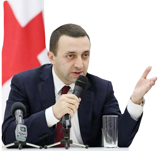
„პრემიერს ჰქონდა ერთი-ერთზე შეხვედრა. მან თქვა, ადამიანურ ურთიერთობებზე ეს არ აისახება, მაგრამ ამის შემდეგ გავაგრძელებ ოპოზიციურ საქმიანობას. პრემიერმაც აღნიშნა, რომ ყველა საკითხი შესწავლილი იქნება და ამის შემდეგ მივიღებ გადაწყვეტილებებსაც. ამაზე კონკრეტულად უახლოეს მომავალში ვისაუბრო“