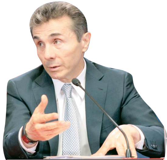
„უხერხულია, როცა ამ ყველაფერს ბიძინა ივანიშვილს უკავშირებს. ბატონ ბიძინას, როცა პრემიერი იყო, პირადად ჰქონდა მითითება მიცემული დუმბაძისთვის, რომ ის თავის სადეპუტატო ფუნქციებს არ უნდა გასცდებოდა და კადრების დაკომპლექტებაში არ უნდა ჩარეულიყო. დიახ, სწორედ ეს არ მოგვინდა ჩვენ და ეს არ მოსწონდა ბატონ ბიძინას“

— ეს მისი ხედვაა, მაგრამ ძალიან ცდება. მისგან უხერხულია, როცა ამ ყველაფერს ბიძინა ივანიშვილს უკავშირებს. ბატონ ბიძინას, როცა პრემიერი იყო, პირადად ჰქონდა მითითება მიცემული დუმბაძისთვის, რომ ის თავის სადეპუტატო ფუნქციებს არ უნდა გასცდებოდა და კადრების დაკომპლექტებაში არ უნდა ჩარეულიყო. დიახ, სწორედ ეს არ მოგვინდა ჩვენ და ეს არ მოსწონდა ბატონ ბიძინას. ეს არ იყო უსაბუთო გადაწყვეტილება, მას ჰქონდა რამდენიმე გაფრთხილება