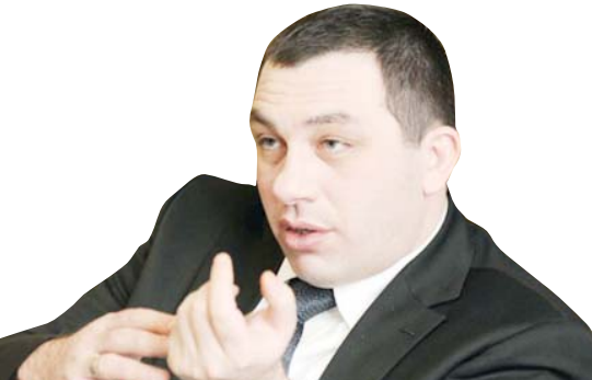
„რასაც ლაბარაკოს უფლავა, ის გულსიმოხს სახელწიფო გადატრიალებას და არა არეულობას, მაგრამ რასაც ლაბარაკოს ბოკურა, ეს არის კონსტიტუციურ ჩარჩოებში მოქცეული საზოგადოებრივი წესის დემონსტრირება. ამიტომ ხელისუფლებამ ყველაფერი უნდა გააკეთოს იმისთვის, რომ „ნაციონალურ მოძრაობას“ ახალი ელექტორატი არ შეემატოს და არავითარი გადატრიალებაც არ მოხდეს“