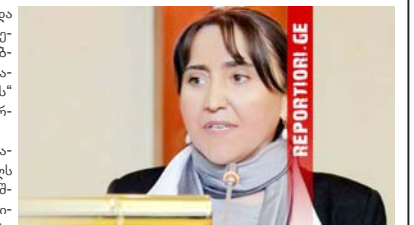
გაგრძელება მე-10 გვერდზე