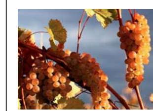
რთველის დანეებიდან დღემდე, ყურძნის მიღება-გადამუშავებაში 65-მა ღვინის მწარმოებელმა კომპანიაში მიიღო მონაწილეობა, სულ რეგისტრირებულია 87 კომპანია. 16 სექტემბრის 11.00 საათის მონაცემებით, გადამუშავებუ- ლია 46 ათასამდე ტონა ყურძენი. მათ შორის, 17 ათასი ტონა რქაწითელი, 27,1 ათასი ტონა საფურავი, 1,4 ათასი ტონა კახ- ური მწვანე და დანარჩენი სხვადასხვა ჯიშის ყურძენი. (რეკლამა)

მათ შორის, ერთი სახელმწიფო ღვინის კომპანია „გრუზვინ- პროშია“. 15 სექტემ- ბერის სულ გადა- მუშავდა 1,038 ათასი ტონა რქაწითელი. კახეთში ამჟამად სხვადასხვა ჯიშის ყურძნის სულ 35 ღვ- ინის ქარხანა იმართებს. რთველის დანეებიდან დღემდე, ყურძნის მიღება-გადამუშავებაში 65-მა ღვინის მწარმოებელმა კომპანიაში მიიღო მონაწილეობა, სულ რეგისტრირებულია 87 კომპანია. 16 სექტემბრის 11.00 საათის მონაცემებით, გადამუშავებუ- ლია 46 ათასამდე ტონა ყურძენი. მათ შორის, 17 ათასი ტონა რქაწითელი, 27,1 ათასი ტონა საფურავი, 1,4 ათასი ტონა კახ- ური მწვანე და დანარჩენი სხვადასხვა ჯიშის ყურძენი. (რეკლამა)