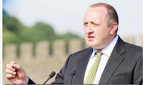
„პარადოქსი ის არის, რომ ხელისუფლება, თითქოს ებრძვის მი- ხეილ სააკაშვილს, მაგრამ ერთადერთი ადამიანი, ვინც ეწინააღმ- დებება სააკაშვილის მახინჯი გეგმის განხორციელებას, არის გიორგი მარგველაშვილი. ფაქტობრივად, მარგველაშვილი ებრძვის სააკაშვილის მიერ ჩაფიქრებული სისტემის განხორციელებას. აღმასრულებელი ხელისუფლება კი ცდილობს, ის მორგოს, ეს ძალიან სახიფათო შემთხვევაა და ერთადერთულად მართის ისეც ქვეყანა“

— ბიძინა ივანიშვილმა ინტერვიუ- ში განაცხადა, რომ მარგველაშვილმა ძალიან ვარჯად იყო, როგორი პრეზი- დენტი იქნებოდა ის. არსებობდა თუ არა მათ შორის შეთანხმება და თუკი არსებობდა, რატომ გადაუწყია მარგვე- ლაშვილმა ამ შეთანხმება? — ზუსტად ესაა პრობლემა. ჩვენ ველაპარაკობთ რაღაც შეთანხმებე- ბზე მაშინ, როდესაც საქმე ეხება სახელმწიფო მართვას, ჩვენ უნდა ვისწავლოთ კონსტიტუციით ცხ- ივრება. ზემოთ შეთანხმებებით და გარეგნებით ქვეყანა არ იმართება. არაფორმალური სამართლის დამკვი- დრება დიდი შეცდომა იქნებოდა ქვეყანაში, ჩვენ ყველამ უნდა ვისწავ- ლოთ კანონის ფარგლებში ცხოვრე- ბა. რა შეთანხმებაც არ უნდა ყო- ფილიყო ივანიშვილსა და მარგვე-