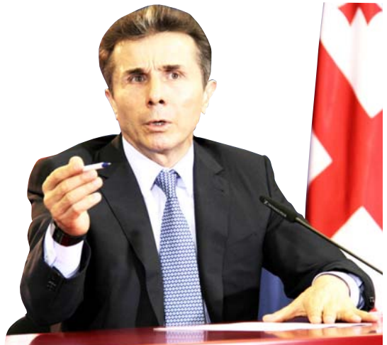
„ბიძინა ივანიშვილის ფაქტორი იქნება საკმაოდ მნიშვნელოვანი და გადაწყვეტი. ხელისუფლების მთავარი დასაყრდენი დღეს არის ივანიშვილის ფაქტორი და ის ნდობა, რომელიც 2012 წელს საქართველოს მოსახლეობამ ივანიშვილს გამოუცხადა...“