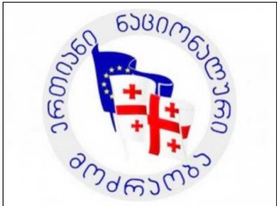
„ნაციონალბს“ თავისი ლობისტები და მხარდამჭერები ჰყავთ მაკეკინის მეთაურობით. ამერიკა არის ლობისტური სახელმწიფო...

ართ კიდევ ასეა? - ვიცოდით, მაგას რომ იტყოდნენ, მაგრამ დემერტმა დამიფაროს. არანაირი სურვილი არ მაქვს მაგათი ნახვის არც იქ და არც აქ.