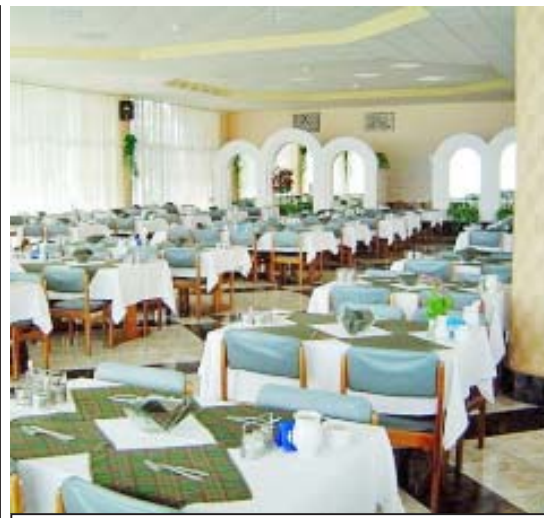
„კონგრესის სასადილოში, სადაც მსოფლიოს ყველა ლიდერი სადილობს, არის ერთი განყოფილება, სადაც ყოველდღე გამოფენილია მსოფლიოს ყველა ქვეყნის საზარეულოს ნიმუშები...“