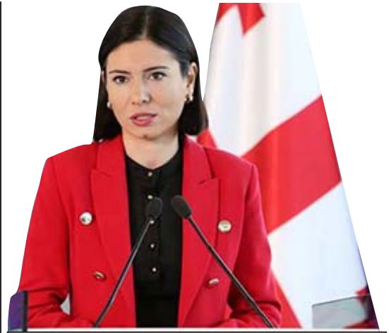
„თუ ვინმე ინტერნეტში მოგაყენებ შეურაცხყოფა, ან დაგეშურებ, თუ თქვენ გახდით კიბერდასახმის მსხვერპლი, ან ფლობთ ინფორმაციას კიბერდანაშაულის თაობაზე, გთხოვთ, მიმართოთ განცხადებით პოლიციას, ან დაგეკავშირდეთ შემდეგ ტელეფონზე: 112 — უფასო ცხელი ხაზი 24 საათის განმავლობაში, ტელ: 2 41 12 96; 2 41 17 67“.

— სხვათა შორის, მარტო მე არ მაქვს თემის ვალდებულება, მეც მე ვარ საჯარო მოხელე, თქვენ ხართ, თქვენი საქმიანობიდან გამომდინარე, საჯარო პირი. მე არ ვახალისებ არავითარ შურისძიებას, ეს არის რეალობა, შეიძლება ადამიანი რაღაც მაროვოკირებულს ქმედების შედეგად მართლა მივიღოთ იქამდე, რომ ვილაცა უშუალო გაუხერხოს. კიბერდანაშაული კანონი ჩვეულებრივი დანაშაულია და ისევე და სხვადასხვა სახით. რამდენადც ჩემთვის არის ცნობილი, ამაზე შინაგან საქმეთა სამინისტროში მიდის