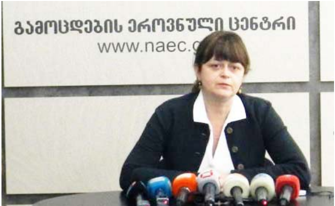
„ჩემი აზრით, ეტყობა, იცოდა, რომ ეს სქონდათ ზარად ამათ პროექტში და ამიტომ ჩაატარა მიმინიშვილმა გაბრუნებულმა ასეთი მკაცრი გამოცდები და ამიტომ ჩაიჭრა ამდენი პაემო, 14% ხომ ჩაიჭრა? არ ვიცი, ეს ყველაფერი, რაზეც ვილაპარაკე, ძალიან მძიმე საკითხია და, დემოთმა არ ქნას, რომ ეს განხორციელდეს, თორემ ყველაფერი დაინგრევა“

სამინისტროს და ვიცი, რომ სქემა საერთოდ არ არსებობს. - ეგ მოიხსება ვინა კილურაზედა? - ჰოდა, ვკითხვოლობ, არსებობს საერთოდ სქემა? რატომ რომ სლაიდებით შემოიბრინა მთელი საქართველო, მაგამი ფულს რატომ ხარჯავენ? პროფესიული გახეთი არ არსებობს? დაბეჭდონ მასწავლებელთა პროფესიული სქემა და, საერთოდ, პროექტი გახეთებში გამოაქვეყნონ.