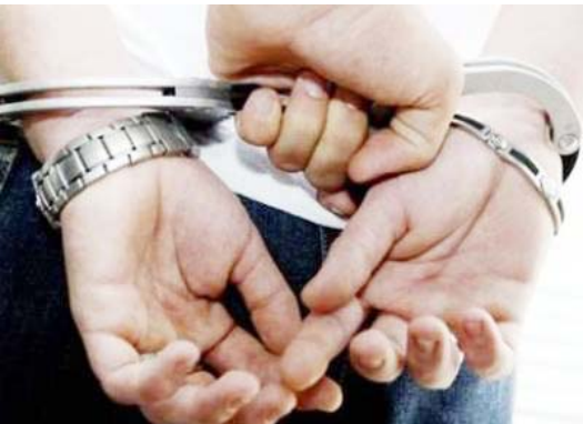
„სკოლაში რომ არ დადიოდნენ, თქვენ გგონიათ, სახლებში ისდნენ? ქუჩაში იყვნენ, არასრულწლოვნების დანაშაული იყო მომტეხული და ცხებები სახე იყო არასრულწლოვნებით. თუ ეს გაკეთდა, დაიწყება: ფული, ფული, ფული“

- არა, მან თქვა, შეასწორეთ სერტიფიკაციის საკითხებთან დაკავშირებით, მაგრამ პარლამენტმა მიაქცია თუ არა ამ საკითხს ყურადღება, ეს არ ვიცი. მაინტერესებს, რომ გამ-