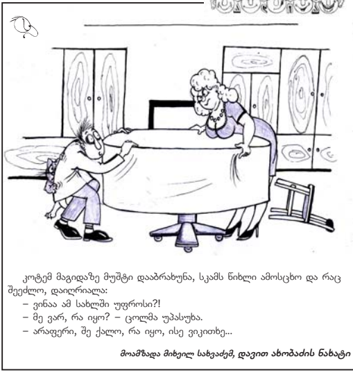
მომზადდა მიხეილ სახეაძემ