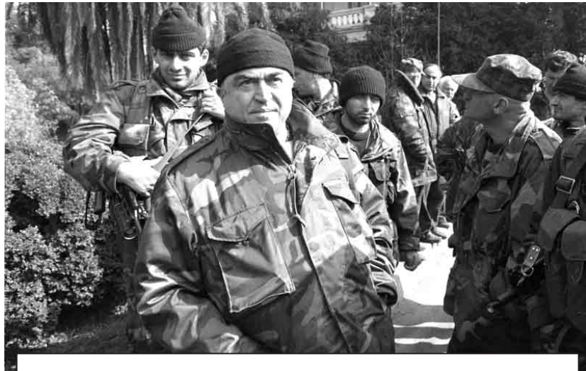
„ერთ მშვენიერ დღეს განაწყენებულმა კიტოვანმა რკონის ტყეში ათკაციანი შეიარაღებული დაჯგუფება წაიყვანა. ერთ კვირაში ეს ათკაციანი დაჯგუფება იქცა 15 ათასად, დღეს რომ ვილაყვამ იარაღი აიღოს ხელში და ტყეში წავიდეს, დარწმუნებული ვარ, მეორე დღეს, ამ ხელისუფლებაზე განაწყენებული 5000 კაცი შეუერთდება“

სახეს და თვითონ დაშავდებოდა. დღევანდელი ხელისუფლება ახსოვლურად მოუშადადებელი შეხვედა ხელისუფლების გადაბარების პრო-