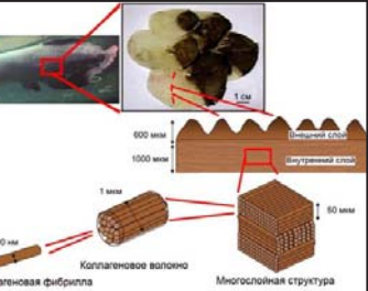
პირანის ქერკლის მრავალფენოვანი სტრუქტურა