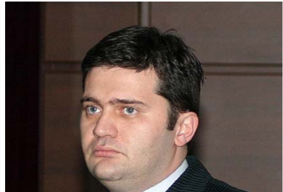
„კანონის მიხედვით, საპატიმრო ვადად ითვლება 9 თვე, ამ პერიოდში უნდა დასრულდეს გამოძიება და სასამართლოს განაჩენი უნდა გამოცხადდეს. ახალაიას შემთხვევაში ხდება აი, რა... ნაუყენებენ ბრალს, გადის 9 თვე, 9 თვის ვადაში მიუსჯიან, მერე ახალ ბრალს ნაუყენებენ, მოკლედ, მის შემთხვევაში დაირღვა 9-თვიანი ვადა, რაც ევროსაბჭოს რეზოლუციამა მითითებულია. აქედან ჩანს, რომ პოლიტიკური ნიშნით არის სამართალი განხორციელებული...“

ია, პრეტენზიები იქნება. მით უმეტეს, როცა კანონიერებაზეა დავა. კანონის მიხედვით, საპატიმრო ვადად ითვლება 9 თვე, ამ პერიოდში უნდა დასრულდეს გამოძიება და სასამართლოს განაჩენი უნდა გამოცხადდეს. ახალაიას შემთხვევაში ხდება აი, რა... ნაუყენებენ ბრალს, გადის 9 თვე, 9 თვის ვადაში მიუსჯიან, მერე ახალ ბრალს ნაუყენებენ, მოკლედ, მის შემთხვევაში დაირღვა 9-თვიანი ვადა, რაც ევროსაბჭოს რეზოლუციამა მითითებულია. აქედან ჩანს, რომ პოლიტიკური ნიშნით არის სამართალი განხორციელებული, საერთაშორისო პრაქტიკა თვლის, რომ 9