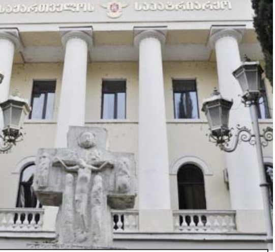
„სამწუხაროდ, პატრიარქის შეგონებას მხოლოდ ის ადამიანები უსმენენ, ვისაც რწმენაც აქვს, სათნობაც და ენაზეც ზრუნავენ. მიმდინარეობს პროპაგანდა, რომ ქართული ენა მცირე ვაგუფის ენაა, რომ მერე საერთოდ გაუჩინარდეს. ახლა დაიწყება რეგიონული ენის სტატუსის მინიჭება, აზერბაიჯანულსა და სომხურს ისე ნამოწვევ, რომ ენობრივად გაგვითანაბრდებიან. ეს ყოვლად მიუღებელია“

დაკარგა. ვინც ვერ შეინარჩუნა, საქართველოში გადასახლდნენ. მერე მასობრივად დაბრუნდნენ სამშობლოში და ყველამ ენა დაიბრუნა. ამით იმის თქმა მინდა, რომ, თუ რწმენას თავში არ დავაყენებთ, ენასაც დავკარგავთ. ეტაპობრივად გვაკარგვინებენ ფასეულობებს, ჯერ იყო ანტიდისკრიმინაციული კანონი და მერე ყველაფერი ეტაპობრივად მოჰყვება. ის, რაც ვერ მოასწრო წინა ხელისუფლებამ, ესენი ცვდებიან გაკეთებას. ყველაფერზე კვირ რომ დაფუკავთ ევროპელებს, არ შეიძლება, პირიქით, ისე უნდა შევიდეთ ევროპულ ოჯახში, რომ ფასეულობების აღრევა არ უნდა მოხდეს. ყველა, ვინც ამ ოჯახში შედის, იცავს იმ ღირებულებებს, რომლითაც მოვიდნენ აქამდე და ჩვენ რა გვეტყა ამ ქართველებს, რომ ყველაფერი თავდაყირა დავაყენეთ. ამ ხალხს ერთი რამ ავიწყდება, რომ უამრავი ისტორიული მაგალითი გვაქვს სთავის ხანებში. დავხმარების სათა-