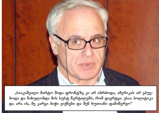
„საკაშვილი მარტო შიდა ფრონტზე კი არ იბრძოდა, ამერიკას არ ეუბნებოდა და ნახულობდა მის სუსტ ნერტილებს, რომ დაერტყა. ესაა პოლიტიკა და არა ის, მე კარგი ბიჭი ვიქნები და შენ ხუთიანი დამინერტო“