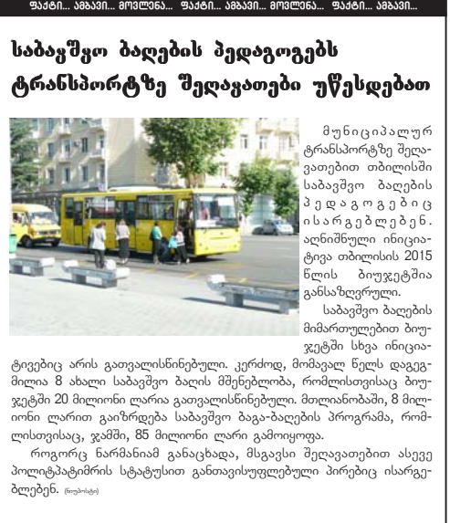
გაგრძელება მე-10 გვერდზე

– ესენი არიან ტიპური გამომძალველები, რომელთაც წლების განმავლობაში ვუხდით ფულს. ყოველ წელს მოხდენენ უფრო და უფრო მეტს, მაგრამ ბოლოს უფურცურ ზღვარს მიაღწია ამითმა მოთხოვნამ, ბევრი მომთხოვეს. 2014 წლის სექტემბერში, უარი ვუთხარი თანხის გადახდაზე, მერე დაიწყეს ეს ამბები და ჩივილი. მანამდე არ ანუხებდათ ძაღლების ყვეფა, სუნით თუ სხვა პრობლემები? 2014 წლის სექტემბრის მერე შეუხდნენ? — თანხას რატომ უხდით და რამდენს? — თანხას იმიტომ ვუხდით, რომ ძაღლები არ დაეხოცათ. იყო ამის, თუ არ ვცდები, 3 მცდელობა, რამდენჯერმე მიემართე პოლიციას. ბოლოს გადაწყვიტე, ეს ვანდალიზმი რომ აღარ განმეორებულიყო, ფული გადაიხადე. — გაგრძელებული ინფორმაციით, 14 მოსახლე გირიეთ და კიდევ 100-კაციანი ბირის მესაკუთრეთა აშხანაგობა. — არა, მე მიმივიან ხათუნა