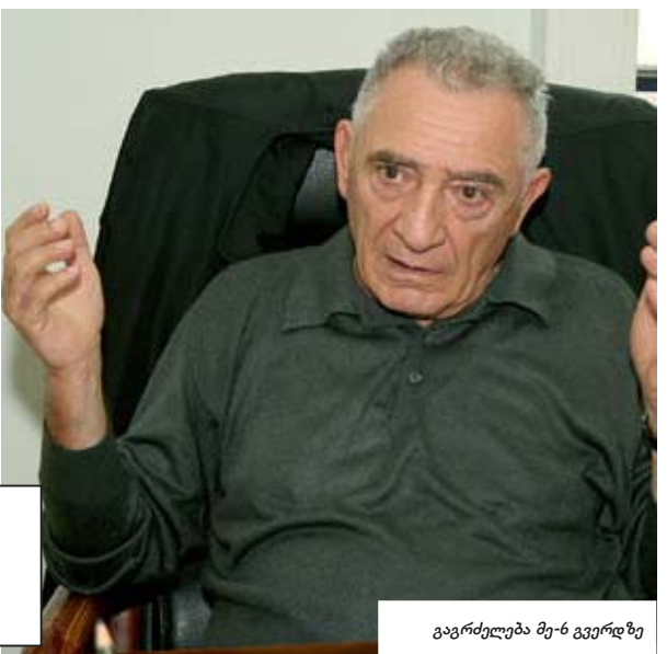
გაგრძელება მე-6 გვერზე