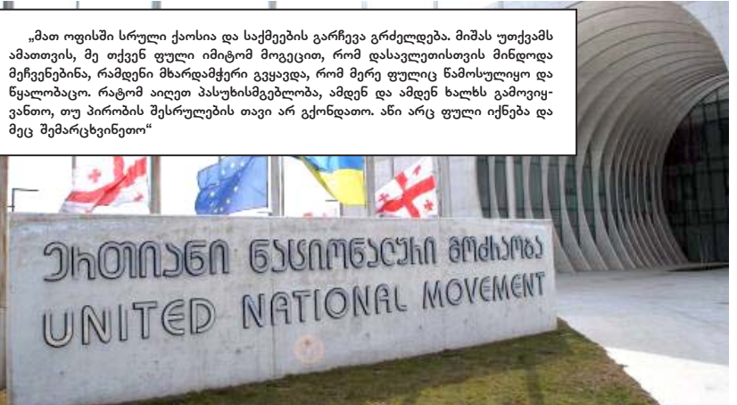
„მათ ოფისში სრული ქაოსი და საქმეების გარჩევა გრძელდება. მიშას უთქვამს ამათთვის, მე თქვენ ფული იმითომ მოგვცით, რომ დასავლეთისთვის მიწოდებდით მეჩვენებინა, რამდენი მხარდამჭერი გყავდა, რომ მე რე უფლისწულსო და წყალობაყო. რატომ აიღეთ პასუხისმგებლობა, ამდენ და ამდენ ხალხს გამოიყვანით, თუ პირობის შესრულების თავი არ გქონდათ. ანი არც ფული იქნება და მეც შემარცხვინეთო“

ისმეგებოდა, ამდენ და ამდენ ხალხს გამოიყვანათ, თუ პირობის შესრულების თავი არ გქონდათ. ანი არც ფული იქნება და მეც შემარცხვინეთო. არც არაფერი უცემიათ, ვერც პროვოკაციები დავგეგმეთ, თქვენ რა ხალხი ხართო. სააკაშვილს უნდა, დასავლეთისთვის ეჩვენებინა, როგორ იქცეოდა 2 წლის მანძილზე ხელისუფლება და როგორ ამოიტესტებს ამას ხალხი, ამიტომ, თუ ნამდვილად სურდა დასავლეთის საქართველოში პროგრესი, უნდა დაყრდნობოდა მათ. ამიტომაც ასალებდა 7 ათას ადამიანს ასი ათასად. საცოდება მიმა, ახელა პასუხისმგებლობა აიღო დასავლეთთან და ახლა დანდობა აღარ იქნება. ახლა ისეთი გამწვანებული ყოფილა, ძლივს აწყენარებენ თურმე. ეს როგორ გამოიხატება, საკუთარმა გუნდმა მილაღატაო.