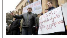
და ის პოლიტიკტიმარია. (სტრუქტურული)