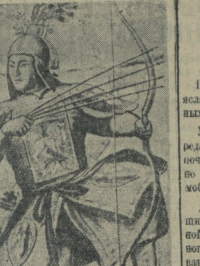
В мае 1940 года отмечается 500-летие великого камажского народного эпоса «Джаруг».

Возвращение в Грозный... (Text reports on the return of people to Grozny.)