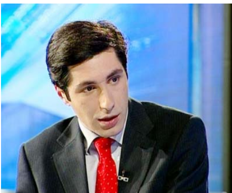
„გარედან მომდინარე სრულიად უსაფუძვლო და არაარგუმენტირებულ შეტევას დავმატა ერთი მოლოდინელი ამბავი შიგნიდან. ტელევიზიის დირექტორმა შეხვედრა მთხოვა. იმ შეხვედრას რამდენიმე ადამიანი ესწრებოდა. დირექტორმა თქვა, რომ მე ჩემი გადაცემებით „მაესტრო“ შესაძლოა, სერიოზულ დაპირისპირებაში შევიყვანო ხელისუფლებასთან და პრობლემები შევქმნა. დირექტორი ძალიან დედად ამათ გამო. ეს ჩემთვის სრულიად გაუგებარი პოზიცია იყო“

ვახო სანაიას ეს განცხადება ადასტურებს, რომ, საგარეოდ, ვერ კიდევ სექტემბერში მოხდა გარიგება „ქართული ოცნებისა“ და