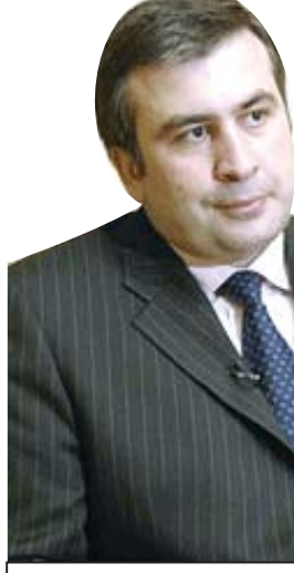
მიხილ სააკაშვილი უკმაყოფილო ყოფილა „რუსთავი 2“-ის მუშაობით სწორედ იმ კუთხით, რომ მას და „ნაცმოძრაობას“, მოუხედავად იმისა, რომ მთელი ტელეკომპანია წელშია გამსყდარი მათი პიარისა და ხელისუფლების „შავი პიარის“ კუთხით, რეალური შედეგები არ მოაქვს, მისი და პარტიის რეიტინგებზე ეს არ აისახება

რისა და ხელისუფლების „შავი პიარის“ კუთხით, რეალური შედეგები არ მოაქვს, მისი და პარტიის რეიტინგებზე ეს არ აისახება. დავით კეზერაშვილის მთავარი მსოფიო ნიკა გვარამიას მისამართით ის ყოფილა, რომ უსაქმურები მოაცილოს არის და ნაკლები ბიუჯეტით უფრო ეფექტური ტელევიზია გააკეთოს, რომელიც სააკაშვილისა და „ნაცმოძრაობის“ რეიტინგის გაზრდას უზრუნველყოფს.