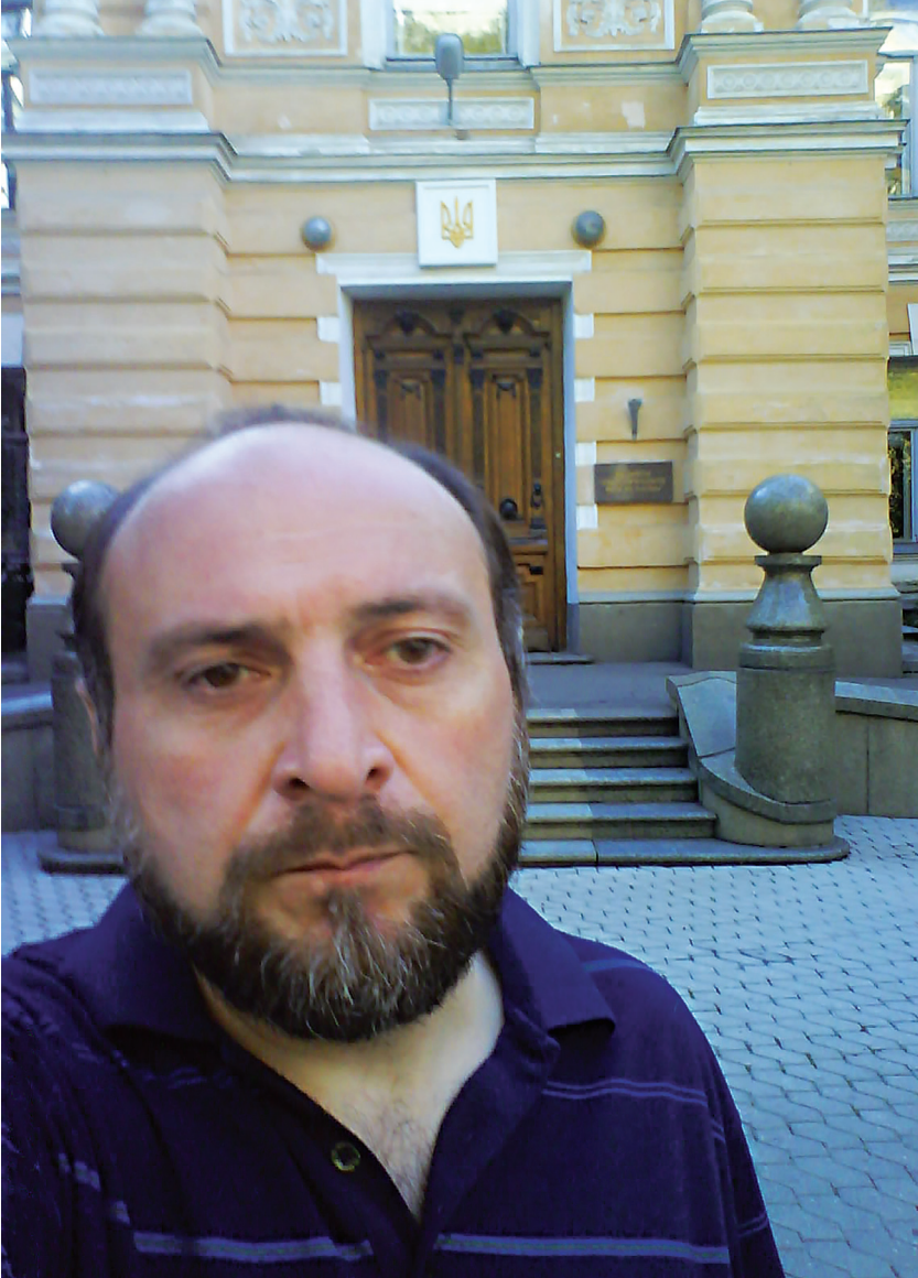
კიევი, უკრაინის მწერალთა კავშირი. Kiev, Writer's Union of Ukraine