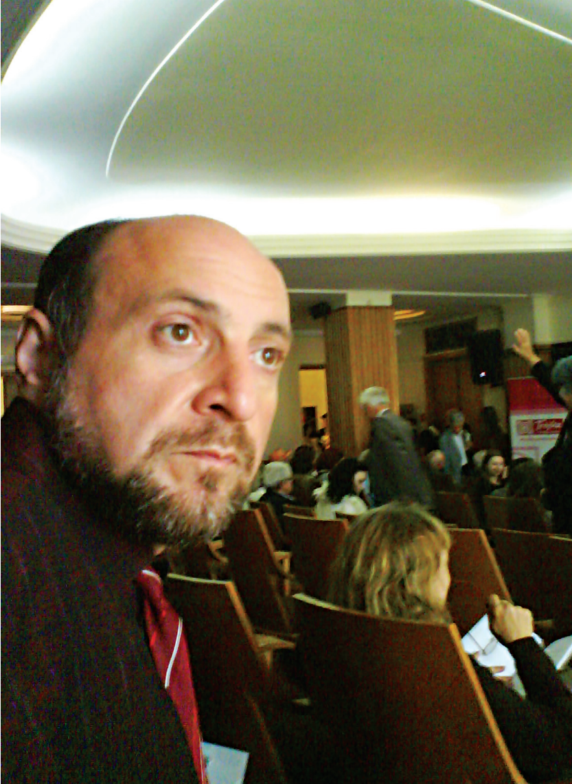
ვარშავა, პოლონეთის ლიტერატორთა (მწერალთა) კავშირის სხდომათა დარბაზი.

Warsaw, Session room of litterateur's (writer's) union of Poland.