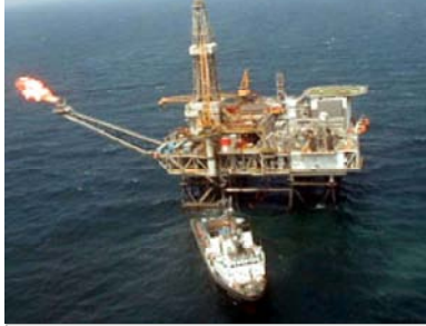
Место рождение «Чрага»

мического развития всех трех стран и еще больше укрепить политическую связь на политикой США в регионе Южного Кавказа и Каспийского бассейна.