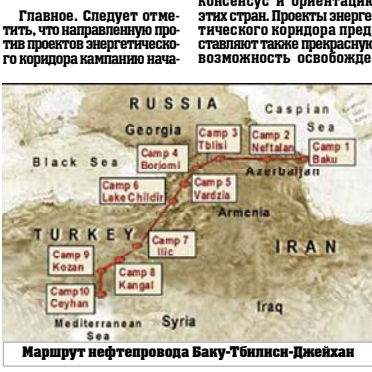
Маршрут нефтепровода Баку-Тбилиси-Джейхан

В рамках энергетического коридора Восток-Запад будет построено два параллельных трубопровода - нефть и газопровод, которые возьмут начало от бассейна Каспийского моря, пересекут Азербайджан и Грузию, достигнут Турции, откуда будет осуществляться снабжение стран Европы. Основа этих проектов заложена при помощи Правительства США. Главная цель поддержки - способствовать процессам экономическому развитию всех трех стран и еще больше укрепить политическую связь на политикой США в регионе Южного Кавказа и Каспийского бассейна.