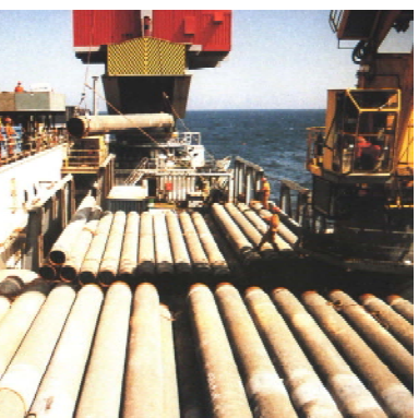
выполнены правовые пункты? Вероятно, те же организации, и их предложение в Грузии и Азербайджане против проекта любого трубопровода, который