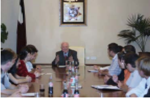
Президент Грузии Эдуард Шеварднадзе со студентами-участниками традиционной встречи.

Как они представляют развитие страны, свою роль и место в этом процессе, что считают главной задачей, какие принципы обуславливают их политический выбор, что приемлемо и что недопустимо тогда, когда страна переживает трудности, и так далее - таким многообразным был спектр вопросов, о которых говорилось на встрече Президента Грузии Эдуарда Шеварднадзе со студентами-участниками традиционной встречи, завершившейся два дня назад в Бакуриани, в Молодежном центре ‘Солнечная долина’.