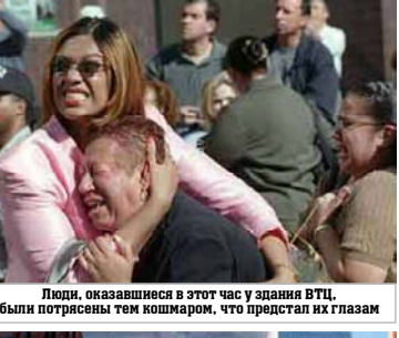
Люди, оказавшиеся в этот час у здания ВТЦ, были потрясены тем кошмаром, что предстал их глазам.