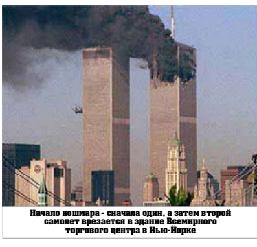
Начало кошмара - сначала опил, а затем второй самолет взрывается в здании Всемирного торгового центра в Нью-Йорке