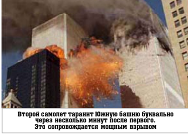
Второй самолет таранит Южную башню буквально через несколько минут после первого. Это сопровождается мощным взрывом