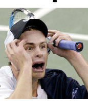
Несмотря на то, что победитель последнего в этом году турнира «Большой шлем» US Open стал американцем, телезрители США в подавляющей большинстве проигнорировали это событие.

Как сообщает AP, финальный матч между Энди Роддиком и испанцем Хуаном Карлосом Ферреро смотрело всего 3,5 процента телеаудитории, чья телевизора в тот момент были включены. К примеру, в прошлом сезоне финальный матч между Питом Самprasом и Андре Агасси собрал вызвал интерес у 6,2 процента телезрителей. Это более плачевные результаты у женского финала. Матч между бельгийками Ким Клейстерс и Жюстин Энен-Арпени показали американцам гораздо менее значимым событием, чем прошлогодний финальный поединок между американками Сереной и Винус Уильямс. В этом году женский финал посмотрели 2,5 процента телезрителей, в прошлом - на 5,2 процента больше.