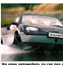
Ни один автомобиль до сих пор не мог ездить по воде со скоростью 48 км/час

Третьего сентября 2003 года жители Лондона наблюдали, как по Темзе на приличной скорости разрезает автомобиль. Что такое? Оказывается, дебют самой быстрой амфибии в мире. Сколько стоит-то? Ого, 150 тысяч