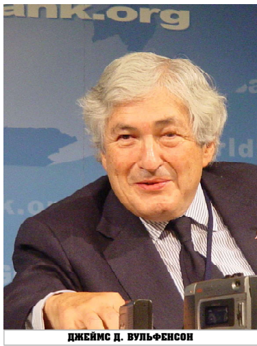
ДЖЕЙМС Д. ВУЛЬФЕНСОН