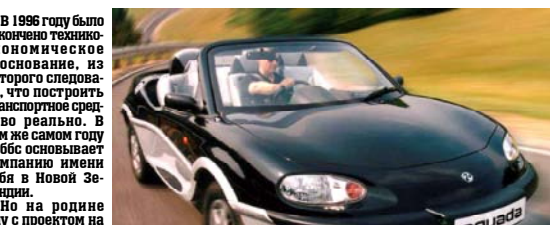
А на трассе машина, как машина

В первый год планировалось выпустить 200 машин — на Gibbs Technologies горят планы целый завод с одним из центров британского автомобилестроения. Сотни машин собираются распродать к концу нынешнего года.