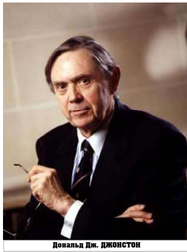
Дональд Дж. ДЖОНСТОН