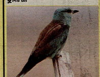
5 ეს ფრინველი ზახფულის განსჯელობაში სამი ათასამდე რკის მარჯვს მინა და წამოთრია თითქმის ყველის პოულობის

მაისი მთვარის განმეორებადი ციკლიდან დასრულება 1. მთვარეობა; 2. კრიზისი; 3. აღმოსავლეთი; 4. პირველი; 5. სახანა; 6. მარჯვნივ; 7. დარბაზი; 8. ფაქობა; 9. კახელი; 10. ახალი; 11. ნილი; 12. სილი; 13. მთა; 14. დანი; 15. დანი; 16. მთვარეობა; 17. მთვარეობა; 18. მთვარეობა; 19. მთვარეობა; 20. მთვარეობა; 21. მთვარეობა; 22. მთვარეობა; 23. მთვარეობა; 24. მთვარეობა; 25. მთვარეობა; 26. მთვარეობა; 27. მთვარეობა; 28. მთვარეობა; 29. მთვარეობა; 30. მთვარეობა; 31. მთვარეობა; 32. მთვარეობა; 33. მთვარეობა; 34. მთვარეობა; 35. მთვარეობა; 36. მთვარეობა; 37. მთვარეობა; 38. მთვარეობა; 39. მთვარეობა; 40. მთვარეობა; 41. მთვარეობა; 42. მთვარეობა; 43. მთვარეობა; 44. მთვარეობა; 45. მთვარეობა; 46. მთვარეობა; 47. მთვარეობა; 48. მთვარეობა; 49. მთვარეობა; 50. მთვარეობა; 51. მთვარეობა; 52. მთვარეობა; 53. მთვარეობა; 54. მთვარეობა; 55. მთვარეობა; 56. მთვარეობა; 57. მთვარეობა; 58. მთვარეობა; 59. მთვარეობა; 60. მთვარეობა; 61. მთვარეობა; 62. მთვარეობა; 63. მთვარეობა; 64. მთვარეობა; 65. მთვარეობა; 66. მთვარეობა; 67. მთვარეობა; 68. მთვარეობა; 69. მთვარეობა; 70. მთვარეობა; 71. მთვარეობა; 72. მთვარეობა; 73. მთვარეობა; 74. მთვარეობა; 75. მთვარეობა; 76. მთვარეობა; 77. მთვარეობა; 78. მთვარეობა; 79. მთვარეობა; 80. მთვარეობა; 81. მთვარეობა; 82. მთვარეობა; 83. მთვარეობა; 84. მთვარეობა; 85. მთვარეობა; 86. მთვარეობა; 87. მთვარეობა; 88. მთვარეობა; 89. მთვარეობა; 90. მთვარეობა; 91. მთვარეობა; 92. მთვარეობა; 93. მთვარეობა; 94. მთვარეობა; 95. მთვარეობა; 96. მთვარეობა; 97. მთვარეობა; 98. მთვარეობა; 99. მთვარეობა; 100. მთვარეობა