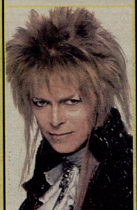
4 ამ ინგლისელი როკ მუსიკოსის ნამდვილი სახელი და გვარი დედოფ როზობ ჯოზე