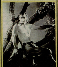
3 ამ პერსიანის შეტახილს ფილმში ერთდროულად ოთხი ადამიანი ამოთქვინებდა