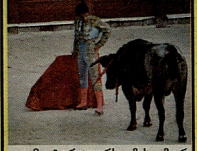
2 ტორედორს მის მიერ მოკლული ხარის სხეულის ამ ნაწილს წყვიან ჯილდოდ