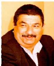
Зидент Шеварднадзе не счел нужным прекратить эту встречу и не бросился в бойсиса умирать скандалистов.

- Согласитесь, конец предвыборного сезона оказался довольно бурным. И все же интересно, какое из событий прошлой недели кажется вам самым важным?