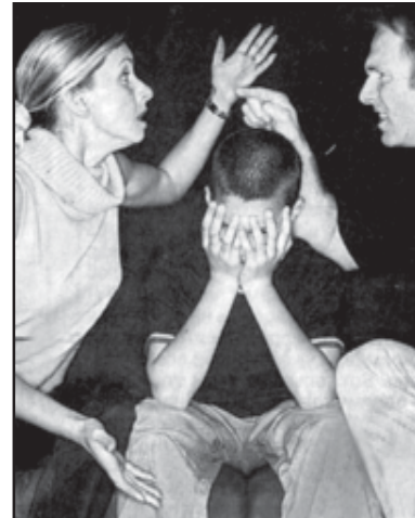
ფილს კი შესაძლოა მამის დანაშაუ-ლებას. საბარაულო ნიშნები თუ ადამი-ანებს, მამოხა დასტურდება.

ქველს ტვინი გამოიყენება. სინამდ-ვილში ახას არსადღს სწავლის ხე-რეხილის განხილვას კალინა მტკიცე-ული პროცედურა. სწორედ ამიტომ ეფინის ბავშვს ტესტის გავლა.