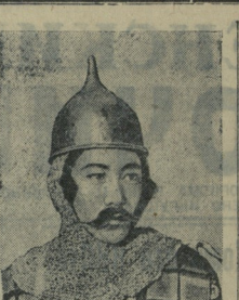
Калмыцкий государственный драматический театр...