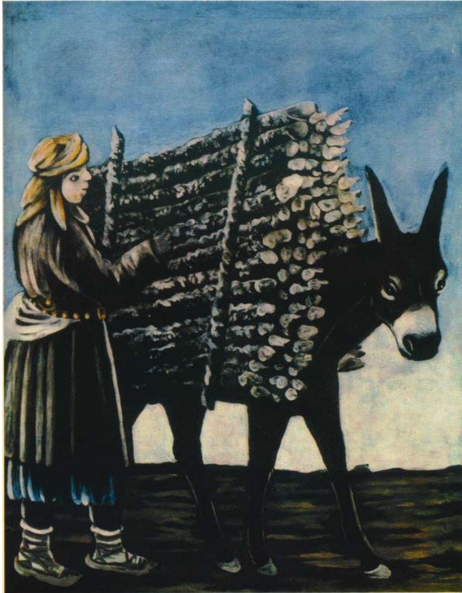
შუმის გამციდველი ბიჭი