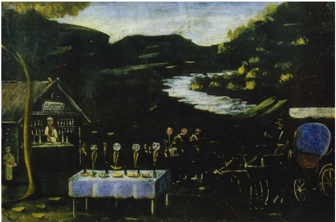
ფაეტონი და ღამის ქვიფი