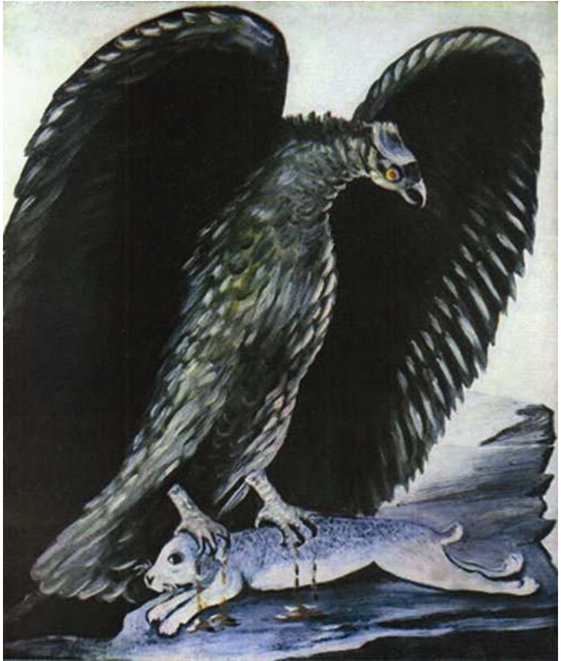
არწივმა კურდღელი დაიჭირა