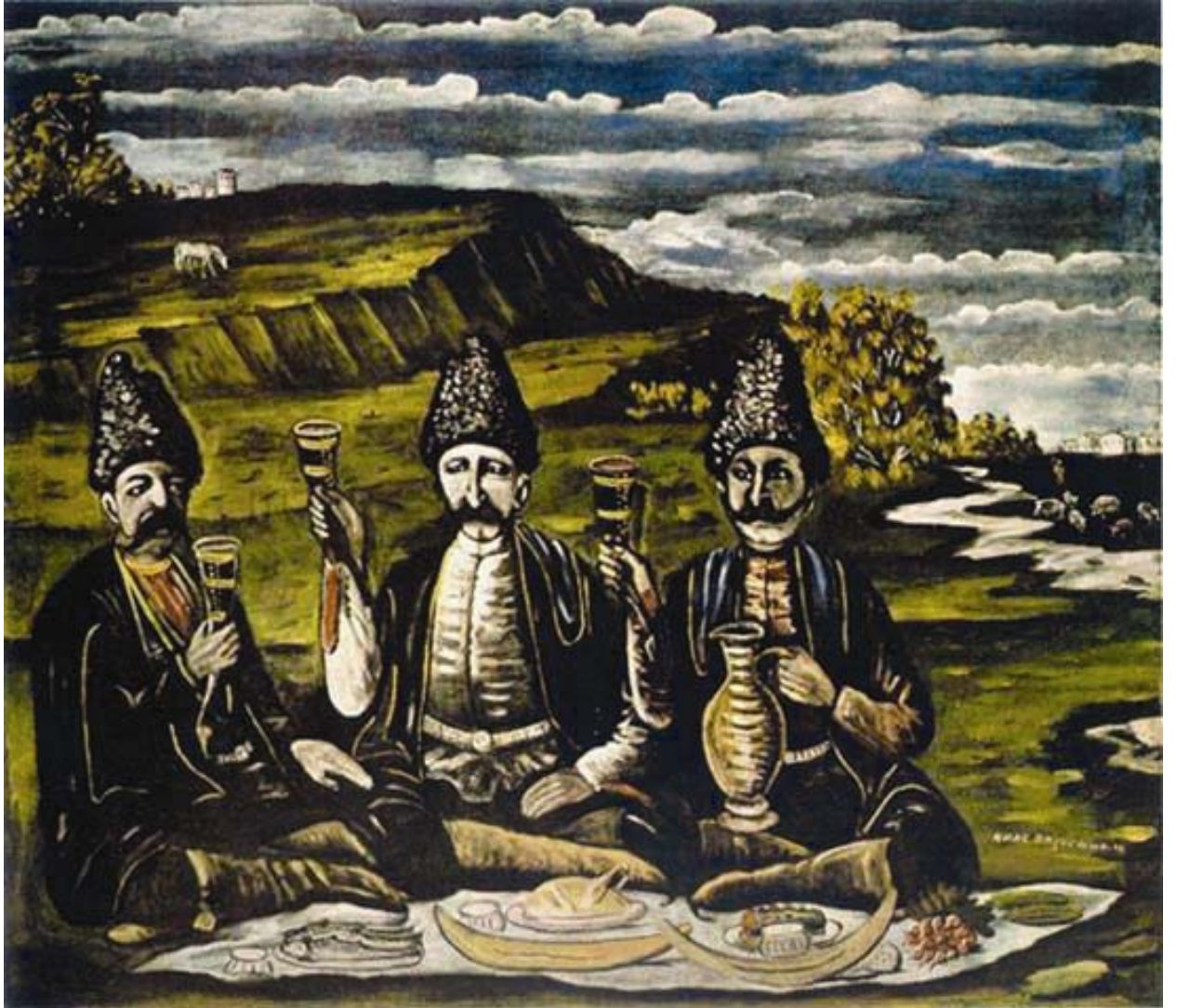
სამი თავადის ქეიფი