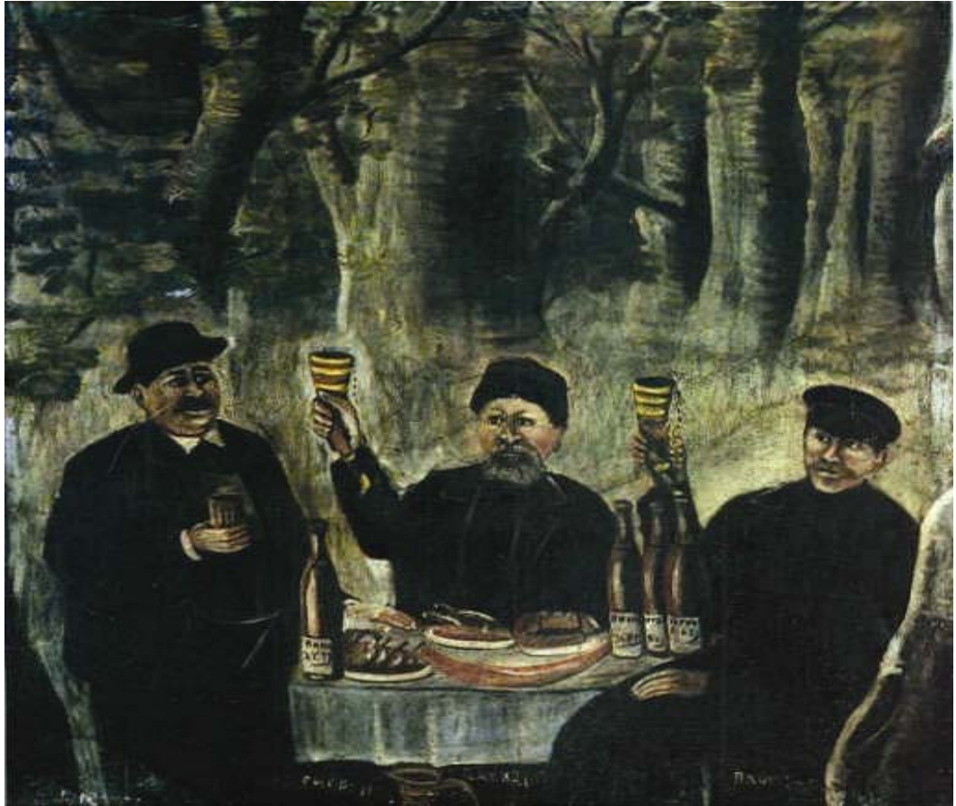
ქალაქელთა ქვიფი ტყეში