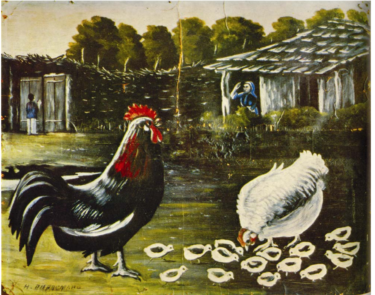
მამალი და კრუხუჩილა