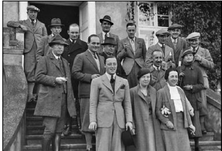
პირველი რიგში (ბარონიდან): პრინცი ბერნარდი, პრინციეს იულიანა და ბარონესა არმარადი; მის შანს - ალექსი ფანულოვი.