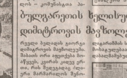
დღევანდელი მსოფლიო გამაგრებულია დამცირების დაზარალებული ცხელი 10