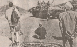
რუსების გამოხატვის კონკრეტული შემთხვევის დროს