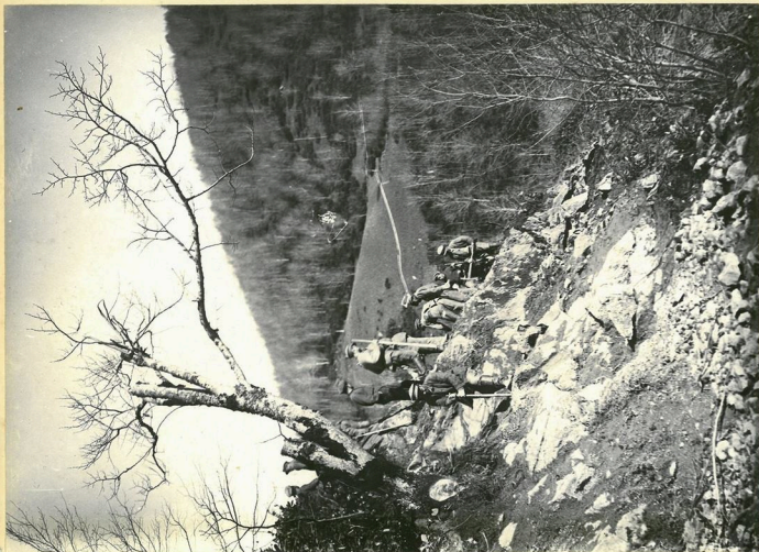
Земляные работы на 1-м серпентине