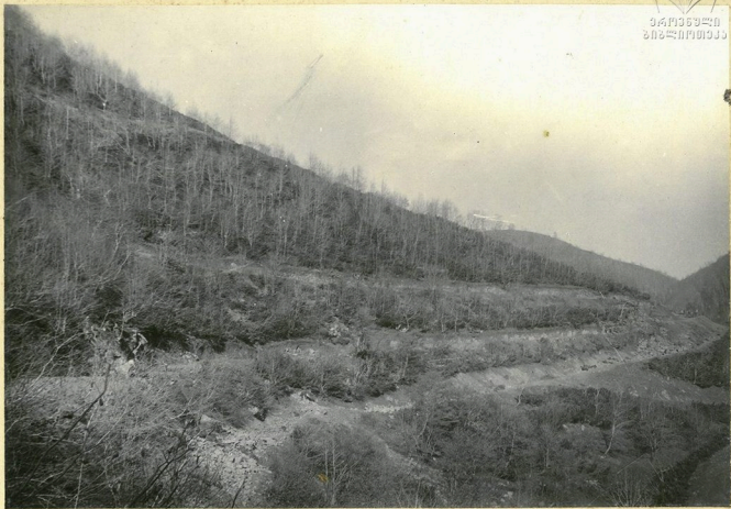
Серпентиниты идущие к перевалу