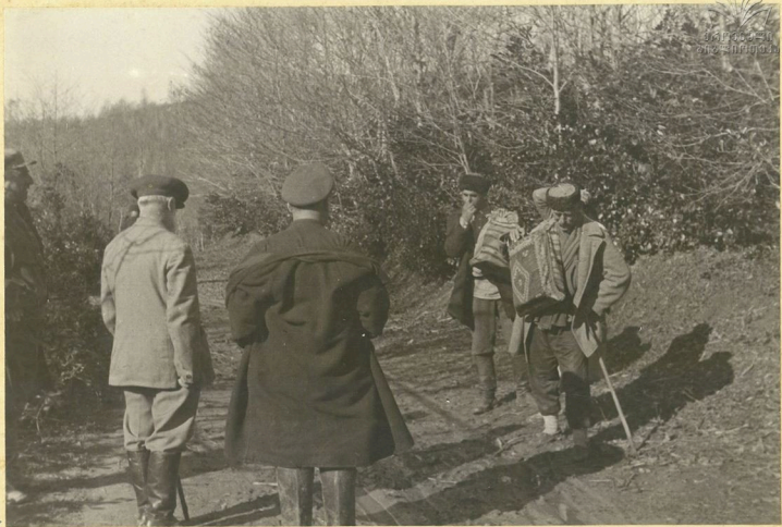
У сел. Хевисджвари т. Ф. Махарадзе беседует с крестьянами