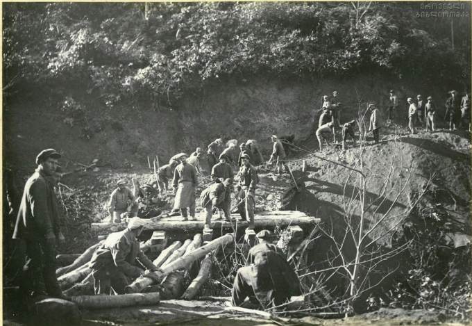
Постройка временного моста на 3-м серпентине