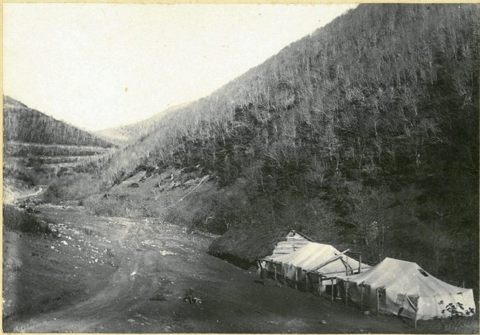
„Вагилатерда“ восточная сторона