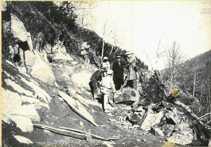
Производство скальных работ на 1-м серпентине