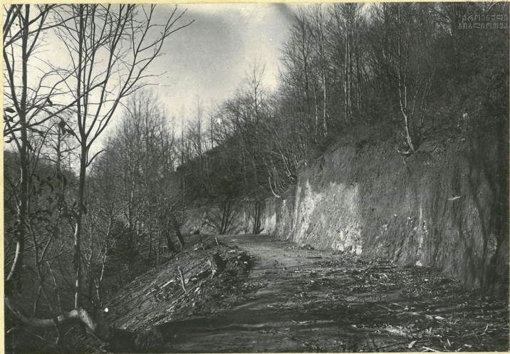
3-й километр от перевала по направлению к Дзгирзулам