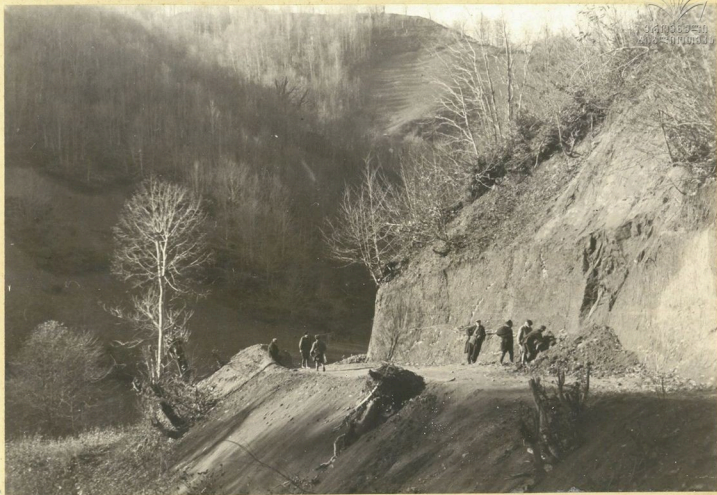
Моб. Ф. Махарадзе около сел. Хеласджвари у родника