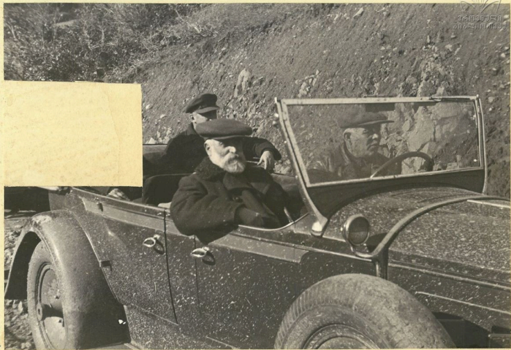
„Вазилетерда“ Слева на право сядят т.