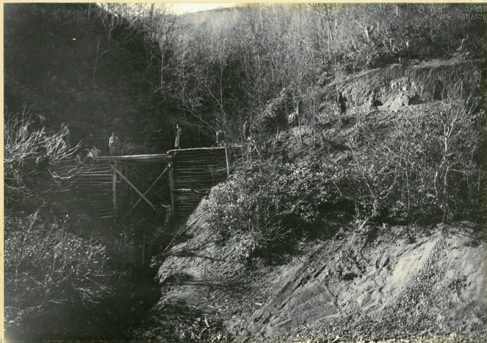
Постройка второго временного моста на 3-м серпантине