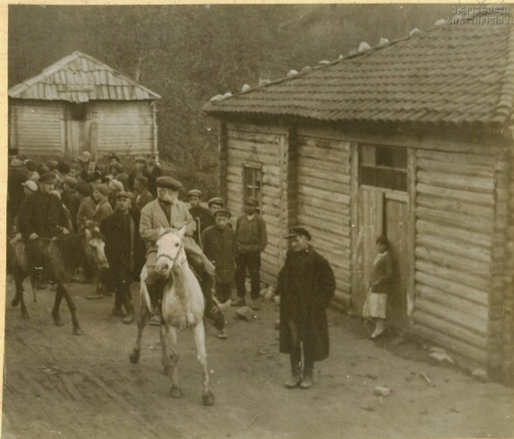
Մոծ. Գ. Մառապոյե,