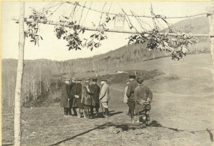
Моб. Ф. Махарадзе на Рикотском перевале