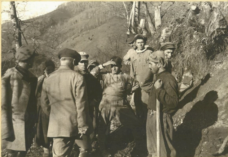
თბ. ფ. Махарадзе беседует с крестьянами