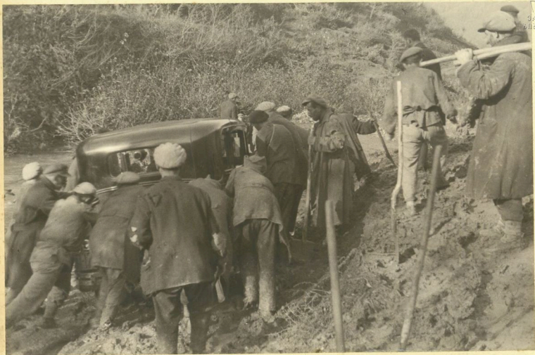
Շեն. Կյուրաթեղալ. 3-րդ կամար. օտ Ըլբարա