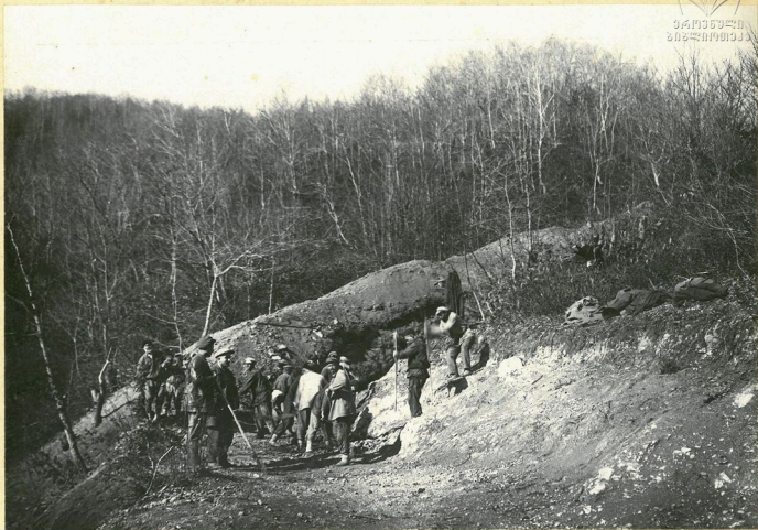
Переход со 2-го серпентина к 3-му