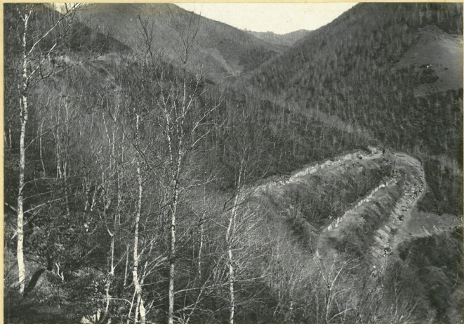
1-ლი და 2-ლი სერენტანგი