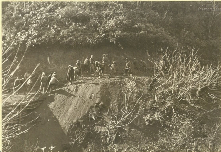
✓ Производство насыпи на 3-м серпентине у моста