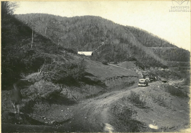
От Цирка в канон. „Бакунария“