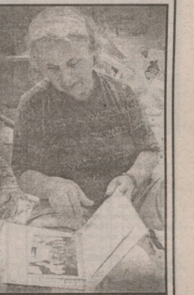
მომიღე ვანელებდა, ამ ქეროლში დანაკარგები 1,7 მილიარდი იქნება.

ბმა, მსოფლიოს მრავალი ქვეყნის წარმომადგენელთა მხარდახმარ, მნიშვნელოვანი წვლილი შეიტანეს ნანგრევებში მოყოლილ დაღუპულთა მოცივებას და დახმარებაში გადარჩენის საქმეში. ჩვენი ქვეყნის მიერ გაწეული ჰუმანიტარული დახმარება მაცხოვრებელთა ექვემდებარება იქნა გამოყენებული კატასტროფით გამოწვეული უბედურების შესამუშევრებლად თურქეთის შიგნით, მთელ თურქი ერი დიდ მადლობას გამოხატავს საქართველოს პრეზიდენტის, საქართველოს საგარეო საქმეთა მინისტრისა და ავსტარი ჩვენი ხალხისადმი იმ თანადგომისათვის, რომელიც ქართველმა ხალხმა გაუწია შეგობარ ქვეყნის. თურქეთის შიგნითა აპირებს თითოეულ ქართველ მამულს პირადად გადაუხადოს გულწრფელი მადლობა.