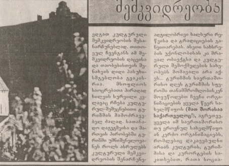
ვლადიმერ კლავდიოვიჩი მუსიკალური მემკვიდრეობის შესახებ...