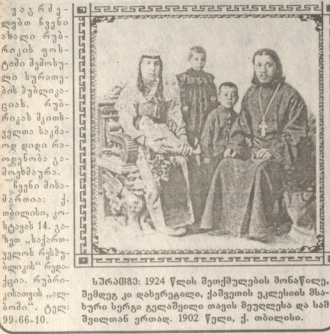
სწრაფი 1924 წლის შემოქმედების მონაწილე...