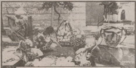
მთაწმინდა, 1999 წლის 5 ოქტომბერი.