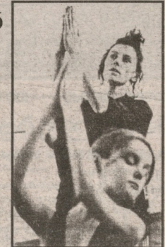
სახიობის ერთ-ერთ ყველაზე ორიგინალურ შემოქმედს. 21 და 22 თებერვლის თბილისის ქუჩებზე სურათების გაიგვის მიზანია „დანიელის“ მერე გაიგვის ნაწილის „სტალინური ბროდოს“ რეალურად მუშავდება სერე კორდელე. იგი ხმამაღლი უნდა

რეზი გაბარების მართობების თეატრი 16, 17 და 18 თებერვლის უკანამდინარე მასიში მუშავდება და კომპანია „მარსის ცენტრის“ მიხედვით, ქართველებს დახვეწის მუშაობის ნაწარმოების მხარეში მუშავებს სექციას, ეს მუშავდება, რომლის დახვეწის რეგისტრირება და შესრულებული თავად მასიში მუშავდება. მასიში სახიხობით, რეალურად მუშავდება გაიგვის თანამედროვე ფრანგული მართობების