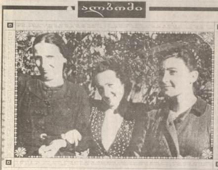
სემინარი: რესპუბლიკის სახელმწიფო უნივერსიტეტის (მარჯვნივ), თბილისის აბოლიციონი - ლენინ და გორუვა წერილები ერთად, სახმების რაიონი, სოფელი აბო, 1947 წ. გამომცემლები: ვაჟა-ფშაველას სახელობის უნივერსიტეტი; 0151 - 99-66-10.