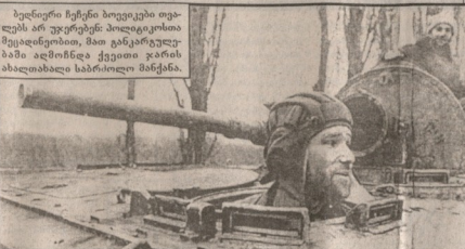
ნაგარო რეკონსტრუქციის პროექტი...