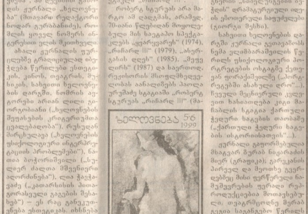
სიმონიძის კონცერტი 1997 წლის იანვარში დაიწყო. მისი მხარეშია ახალგაზრდა ჯგუფის მხარეშია...