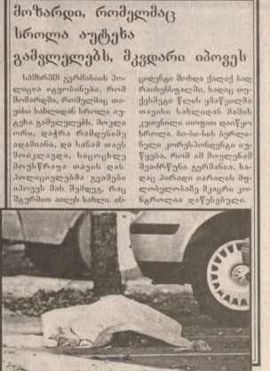
მიხრაი, რომელიც სრული აუტუსა...