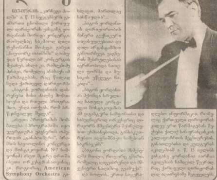
სიმონიძის კონცერტის შემდეგ, ახლა კი რეჟისორი ახალგაზრდა ჯგუფის მხარეშია.