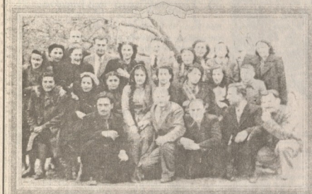
სამხრეთი თბილისი ფულმ "აკვის ბენდის" გადაღებული შემოქმედებითი კვლევა. მუხარამიანი, 1997 წ.

მუხარამიანი, ვაჟა-ფშაველას ფოტოცენტრში. მუხარამიანი, ვაჟა-ფშაველას ფოტოცენტრში. მუხარამიანი, ვაჟა-ფშაველას ფოტოცენტრში.