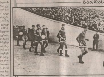
ბარდასუ ღლით ხიზლი