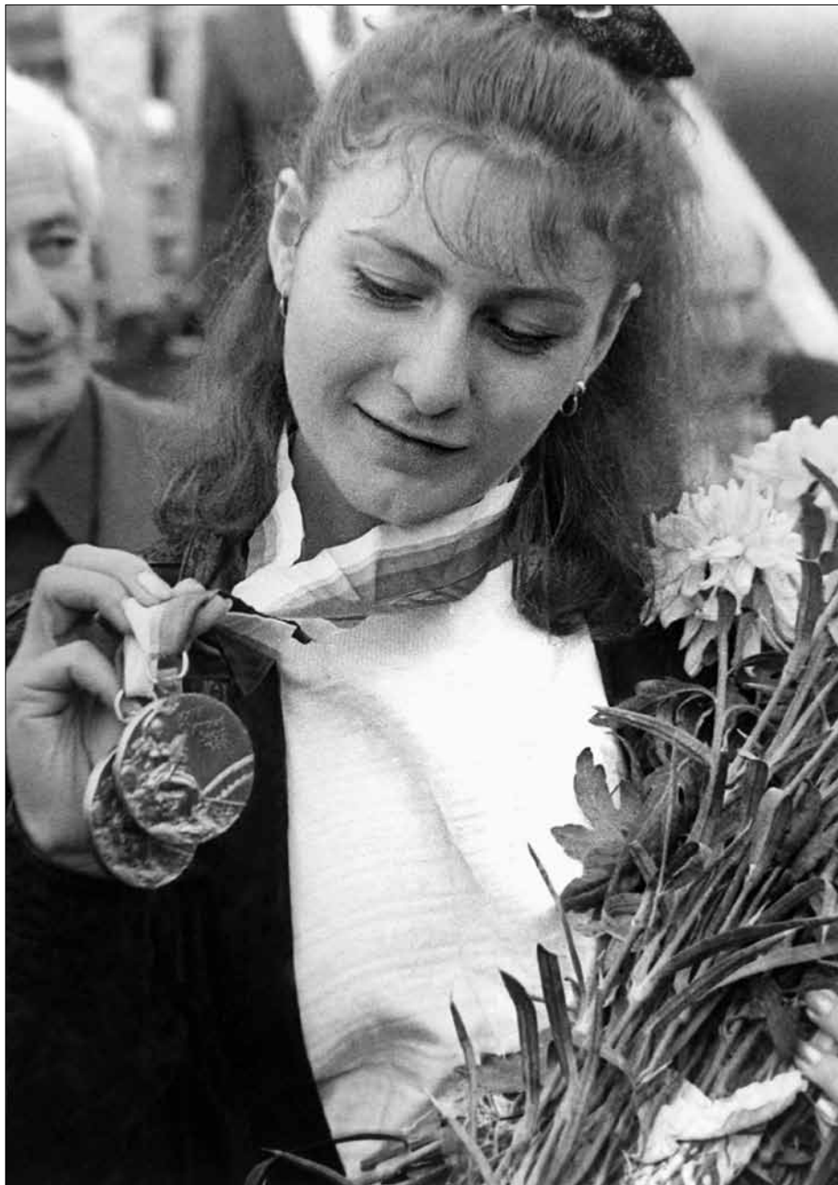
„აი, ჩემი ოქრო-ვერცხლი.“ თბილისის აეროპორტი, 1988 წელი