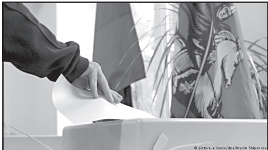
მომზადდა ნიკა თევზაძემ

ხმებს მაინც გააყალბებენ! ამიტომ არა სჯობია, რამე გამორჩენა მაინც ვნახოთ? - ამბობენ ისინი.