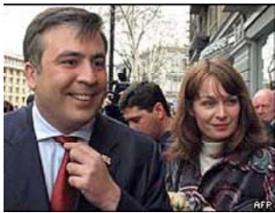
Михаил Саакашвили. Общественная ситуация в Грузии осложняется усилившимися противоречиями

Таким образом, в ходе воскресных выборов все 150 депутатских мандатов достались партии Саакашвили. Избирательные участки закрылись в 20:00 по местному времени (15:00 по Гринвичу). По данным на 17:00, в выборах приняли участие 51% избирателей. Для признания выборов состоявшимися, на них должны проголосовать не менее одной трети избирателей.