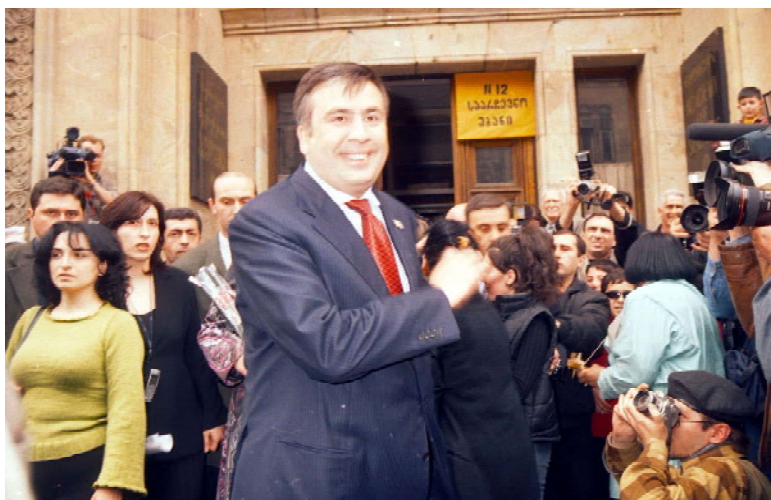
Спустя час после того, как председатель Центризбиркома стал оглашать первые предварительные дан-

ные об итогах выборов 28 марта, руководители «Международного общества справедливых выборов и демократии» (ISFED) ознакомили общественность с результатами параллельного подсчета голосов.