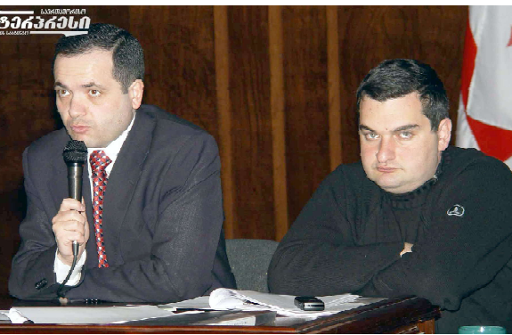
Аджария глава ЦИК Грузии Зураб Чхаберашвили возложил на руководство Аджарской автономии и потребовал от президента Грузии Михаила Саакашвили...

33 тысячи 329 бюллетеней признаны недействительными. Центральная избирательная комиссия аннулировала итоги голосования в 52 избирательных участках по всей территории республики.