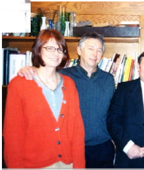
В гостях у друзей в Портленде