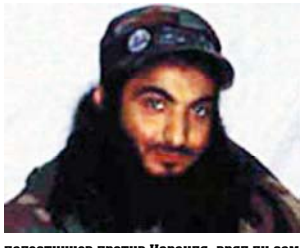
палестинцев против Израиля, вряд ли сам когда-нибудь брал в руки автомат или взрывчатку.

Сравнение, правда, не вполне корректное, так как аль-Валид - если это действительно его убийца в ходе ночной спецоперации в нигусском селе Орджоникидзевская Сунженского района - погиб в бою с оружием в руках. Аль-Рантисси встретил смерть в автомобиле, проезжая по улице Тель-Авив, его машина попала под ракетный обстрел израильского военного вертолета. Но спецслужбы в каждом регионе мира действуют, исходя из местных условий - аль-Рантисси, будучи одним из вдохновителей террористической деятельности