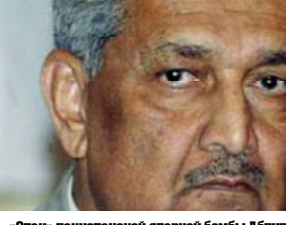
местный уран, сообщает Associated Press.

Однако, этим подозрения не ограничиваются. Начиная с 1988 года, когда Пакистан впервые испытал ядерную бомбу, Абул Кадир Хан периодически связывался с разными странами со слабыми и нестабильными режимами, предлагая им незаконные сделки с разного рода ядерными вооружениями. По информации агентства, с целью налаживания незаконного сбыта ядерного оружия и технологий, он побывал в Ливии, Северной Корее, Иране, Судане и других странах. В этом его подозревают высокопоставленные чиновники в администрации Джорджа Буша. По их словам, Кадир Хан пытался наладить поставки оружейного урана в Пакистан в обмен на помощь в развитии местных ядерных программ.