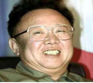
Визит Ким Чен Ир, который, как и всегда, хранился в стражайшей тайне, начался меньше чем через неделю после того, как вице-президент США Дик Чейни заявил в Пекине, что время для решения ядерного кризиса в Северной Азии уходит впустую.