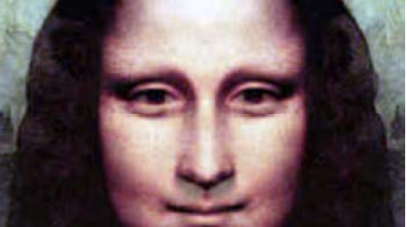
изменений климата. Заодно они смогут уточнить состав использованных Леонардо красок. Пока картина остается на своем постоянном месте, однако в начале 2005 года ее перенесут в отремонтированный, специально оборудованный зал. Сейчас портрет

Эксперты Лувра утверждают, что «Мона Лиза» начала стареть, сообщает ВВС. Начала деформироваться тонкая деревянная рама, к которой крепится холст, и это вызывает у хранителей музея серьезное беспокойство. Вызванные специалисты считают, что деформация и разрушительные процессы зашли дальше, чем это предполагалось, и сейчас изучают подверженность картины и рамы влиянию