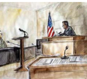
Суд над американскими военными в Багдаде

Военные сообщили, что солдаты, ответственные за содержание арестованных журналистов, были опрошены под присягой. «Никто не признался и не сообщил о применении физического насилия по отношению к арестованным или о фактах пыток». На задержанных оказывалось разумное целесообразное давление, в том числе и лишение сна, но только для того, что-