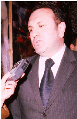
Посольство Грузии в Москве намерено также уделять вопросам информированности особое пристальное внимание. В скором будущем планируем презентацию сайта нашего посольства. «Культурные и научные связи, несмотря на это, оставались стабильными в последние годы. Может ли журналистика способствовать развитию дальней-

зию. Это довольно симптоматично. Думаю, так же обстоят дела и в других направлениях, тоже надо работать. Хотел бы подчеркнуть, что атмосфера в информационной сфере, уровень и характер контактов и взаимодействия серьезно влияют на последние политические отношения между нашими странами. - Есть ли интерес у жителей Грузии к событиям в России и имеют ли они возможность оперативно получать такую информацию? - В Грузии интерес к событиям в России стабильно высок. Причем он, как я полагаю, будет возрастать по мере укрепления политических и половых кругов, общественных отношений. Растет и доверие между нашими странами. Отнюдь не случайно, что сейчас в Грузии проявляют все больший интерес к объективному мнению политических партнеров в двусторонних деятелях России. Так что в Грузии очень внимательно следят за событиями в нашей стране. Что касается информированности, то я хочу отметить агентство РИА «Новости», его предложение «Российский вестник» и газете «Свободная Грузия», информационное агентство «Новости-Грузия», которые играют солидную роль в удовлетворении информационных потребностей грузинского общества. Об огромном интересе свидетельствует и тот факт, что в Грузии издаются самые разные газеты, выходящие в эфир передачи на русском языке.