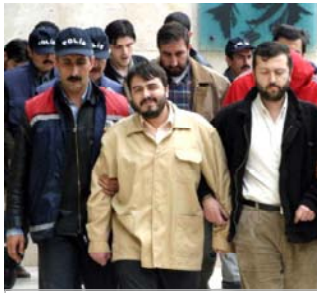
Арест террористов в Бурсе