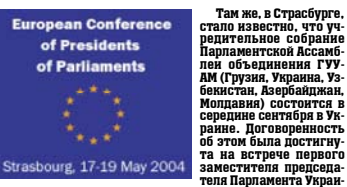
Страсбург, 17-19 мая 2004