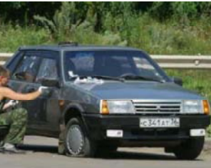
Взрыв в Воронеже

УФСБ напоминает о том, что чеченские боевики неоднократно предпринимали попытки совершения террористических актов в Воронеже. Первый раз в 1996 году - попытка взрыва здания железнодорожного вокзала «Воронеж-1», второй раз в 2001 году - взрывевого ряда «Пр-