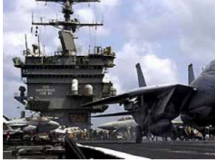
Авианосец на море

на специальную посадочную палубу для самолетов. 1920 год. Британский авианосец Eagle впервые оснащен надстройкой типа «остров», которая ныне является неотъемлемой принадлежностью всех авианосцев. На «острове», расположенном над правым бортом, размещались капитанский мостик, палуба, две трубы и артиллерийское оружие. Взлетная палуба занимала все остальное пространство палубы авианосца. Любопытно, что прототипом всех авианосцев мира «остров» размещался именно по правому борту - в 1918 году соответствующее решение принял британский Адмиралтейство. Причина была следующей: в ходе наблюдения было установлено, что летчики, не сумевшие «приземлиться» на палубе, почему-то предпочитают поворачивать самолет налево. 1922 год. Японский Hoshio стал первым кораблем, изначально спроектированным в качестве авианосца. Год спустя на нем был спущен британский авианосец Hermes. В том же году США переоборудовали угольный транспорт в авианосец Langley.