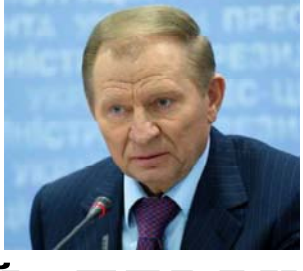
Леонид Кучма, президент Украины

В новой редакции доктрины эта формулировка сокращена до проведения полити-