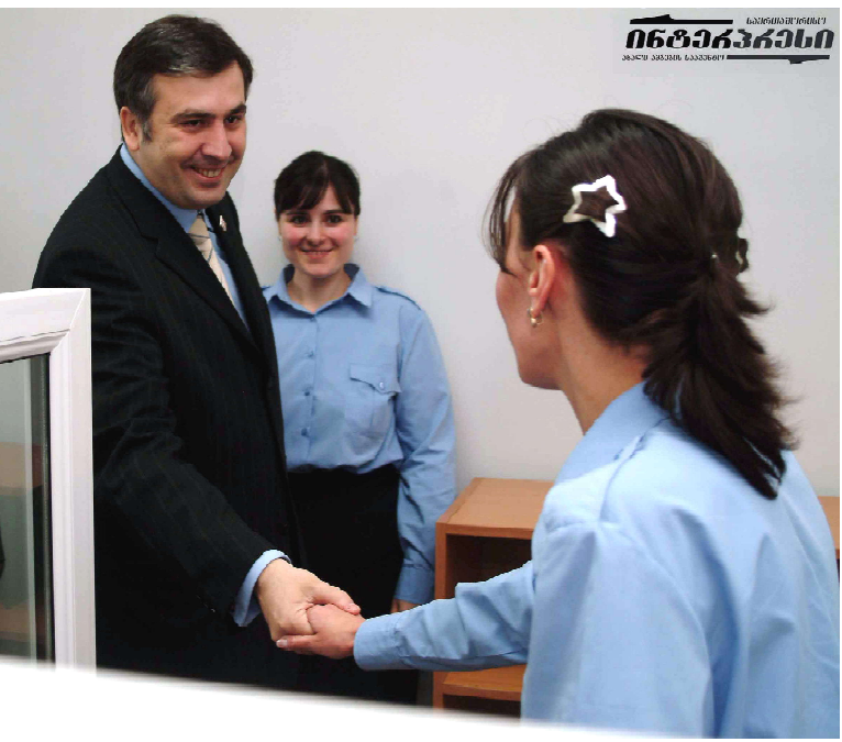
სააკაშვილი საქართველოს პრეზიდენტი