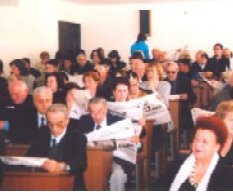
одним из основных преемников которого стал «Институт бухгалтерского учета»