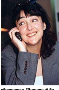
обстановке. Шикарный буддвар дамы 30-х годов прошлого столетия как нельзя лучше.

Ранее на сайте клиники хирурга появились несколько материалов, где 46-летняя звезда фильма "Челси" и "Основной инстинкт" и "Казинго" называлась в числе знаменитостей, которым проводились здесь пластические операции.