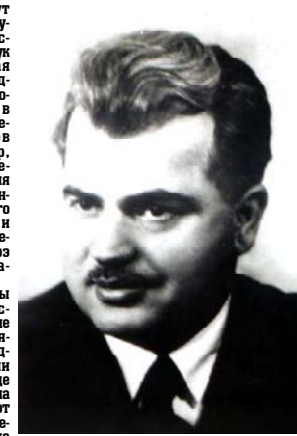
Петр Афанасевич Шария

Накануне юбилейной комиссии, государственные и общественные деятели, близкие родственники посетили Верийское кладбище и возложили венки на могилу ученого.