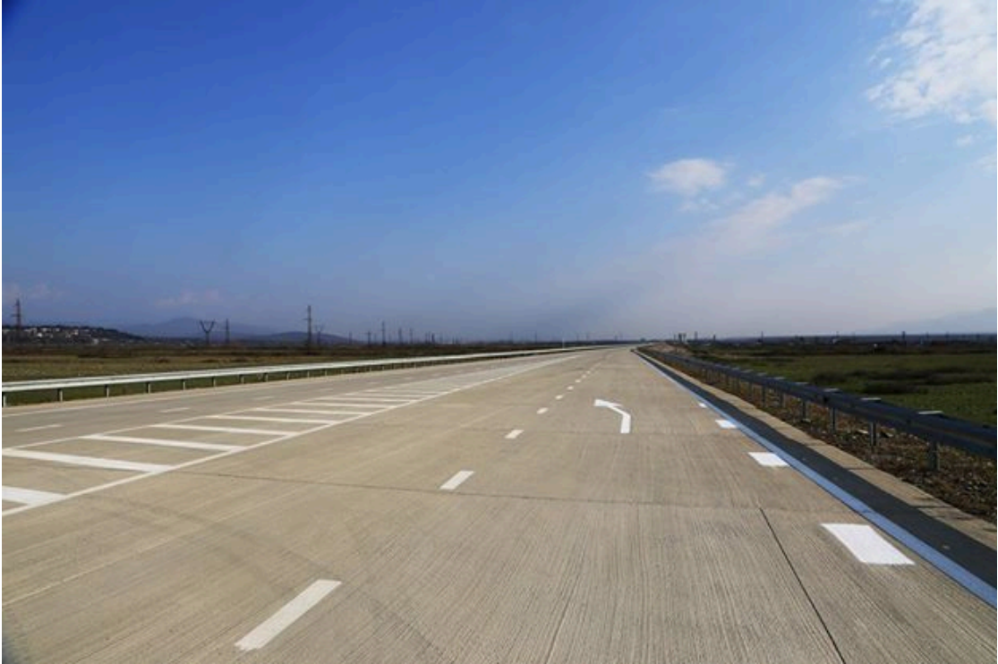
ნახ.1 ქუთაისის საერთაშორისო დანიშნულების შემოვლითი გზა