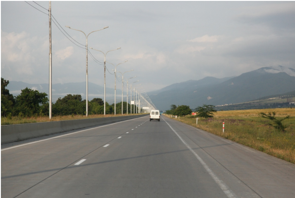
ნახ.2. თბილისი -სენაკი-ლესელიძის საავტომობილო გზა.

შემდგომ ეს ბეტონები გამოყენებული იქნა საერთაშორისო მნიშვნელობის ჩქაროსნული საავტომობილო გზის თბილისი-სენაკი-ლესელიძის ადიაანი-იგოეთის მონაკვეთის მშენებლობაზე (იხ. ნახ.2).