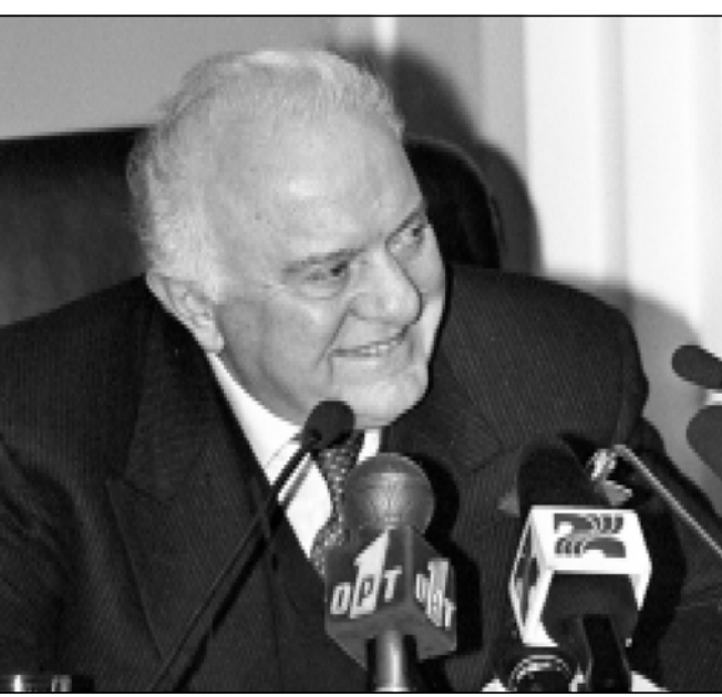
забыли, что мы являемся инициаторами этого соглашения по СНГ. К

Экономическая интеграция, способствующая укреплению независимости государств, безусловно, заслуживает полной поддержки. Мы поддерживали и будем поддерживать ее. К этому ведет, например, договор о свободной торговле. Вы, надеюсь, не