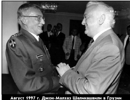
Август 1997 г. Джон-Малхаз Шаликашвили в Грузии

Изявно потрудившись над жизнеописанием Наполеона Бонапарта, Стендаль изрек как-то мысль изначальную, небесспорную, но логически четко выстроенную и оттого ставшую за прошедшие полтора столетия классическим троизмом. А молвил мастер следующие: "Жизнь человека описывать легко до тех пор, пока он не прославил свое имя". Стендалевское высказывание, касавшееся литературных энциклопедий, с поправкой на время абсолютно созвучно и попыткам служителей иной, требовательной музыки кино - представить зрителям портрет знаменитости. Представить так, чтобы документ (речь идет о неигровом кино) не перетасовывал на экране общеизвестные факты, а явил живой, полнокровный образ героя без лафосной ретуши и казенного славословия. Сделать это очень не просто. Тем более, если герой фильма - фигура крупномасштабная по всем параметрам.