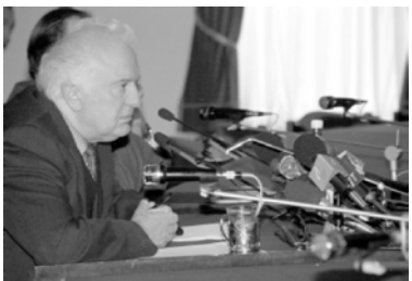
Эдуард Шеварднадзе и другие участники брифинга.

Быть может, парламент пожелает внести и другие изменения. Если один блок имеет право попросить об изменении, то почему этого права должна быть лишена