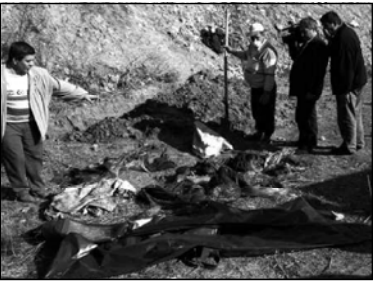
Турецкая армия с гневом опровергла сообщения о том, что она как-то связана с радикальной исламской группировкой «Хезболла». В заявлении руководства Вооруженных сил Турции эти сообщения называются клеветническими и бессмысленными. В последние дни появились сообщения о том, что «турецкое отделение» берет свое начало в специальном антитеррористическом отряде, созданном властями для подавления курдских сепаратистов. Тем временем полиция обнаружила тела еще двух человек, похищенных, по ее словам, «Хезболла». Так что общее число жертв группировки достигло тридцати трех.