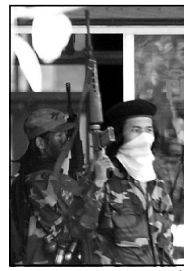
предоставить врачей для лечения раненых повстанцев.

удалось бежать. Сообщают, что нападавшие принадлежат к повстанческой группе народности карен, называющей себя Армией Бога, которой руководят два брата-близнеца, достигшие еще и двадцати лет. Они потребовали от тайландских властей пустить на территорию страны беженцев своей народности, которые бегут из района от вооруженных столкновений между повстанцами и бирманской армией. Они также требуют