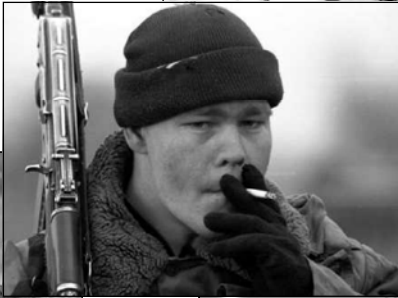
видео. Между тем наконец выяснилась судьба генерала Михаила Малофеева, исчезнувшего в Грозном