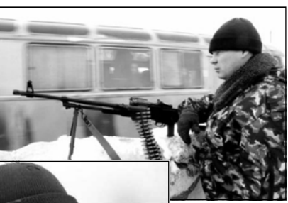
на прошлой неделе. Российские военные нашли тело генерала в Грозном и доставили его во Владикавказ, откуда оно было отправлено в Петербург, где состоятся похороны.

Владимир Путин заявил, что сроки военной кампании в Чечне не должны зависеть от политической конъюнктуры. «Сроки определяются только военной целесообразностью», - заявил Путин в интервью российскому теле-